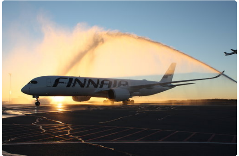
Finnairin kolmastoista Airbus A350 -kone laskeutui Helsingin lentoasemalle Ystävänpäivänä. Tämä kuva on lokakuulta 2015, jolloin ensimmäinen, kauan odotettu yksilö saapui.