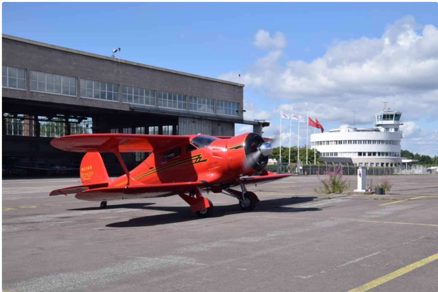
Vuoden 1944 Beechcraft vieraili heinäkuussa Malmilla. Hangaarin tilanne on epäselvä ja kiistanalainen.