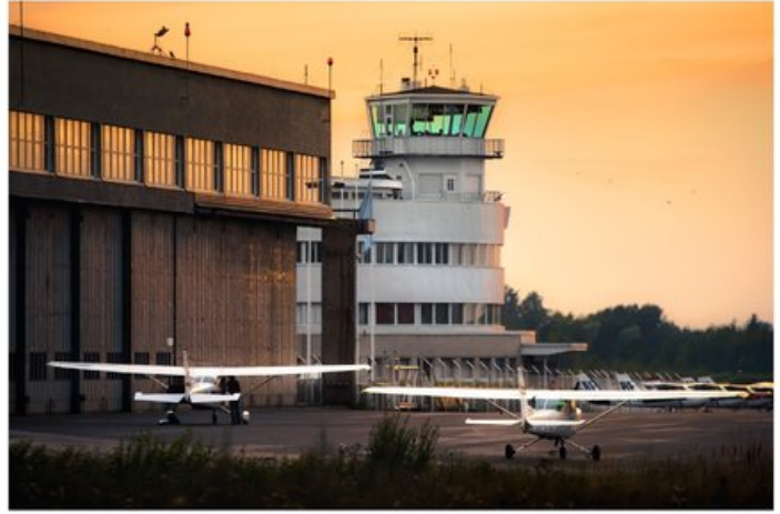
Hangaari oli valmistuessaan yksi Euroopan suurimmista rakennuksista.

Hyvönen on huolissaan myös virkamiesten jaksamisesta: "Kansalaiset ovat kovin vihaisia, ja vaikka yhdistyksenä pyrimme pitämään tilanteen rauhallisena, tulee virkamiehille varmasti paljon painetta. Toivottavasti ilmailukäytön jatko saadaan varmistettua pikaisesti, että tilanne rauhoittuu