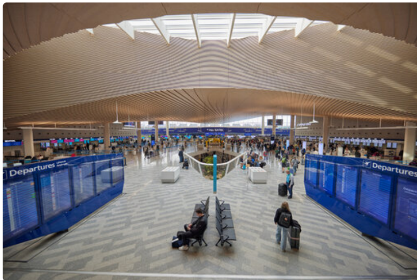
Helsinki-Vantaan lentoaseman lähtöaula.

Helsinki-Vantaan lentoasema on valittu kolmena vuonna (2018–2022) Euroopan parhaaksi lentoasemaksi kokoluokassaan ja viitenä vuonna Pohjois-Euroopan parhaaksi lentoasemaksi (2016–2023). Tämän lisäksi lentoasema on saanut lukuisia kansallisia ja kansainvälisiä palkintoja ja tunnustuksia muun muassa projektijohtamisesta ja rakentamisesta, tietomallinnuksesta hankkeen eri vaiheissa, arkkitehtuurista ja suunnittelusta ja ravintolapalveluista sekä vastuullisen rakentamisen sertifikaatteja. Eri liikennemuodot linkittävän matkakeskuksen suunnittelu- ja toteutusvaiheeseen Finavia sai noin 9,6 miljoonaa euroa EU-rahoitusta.