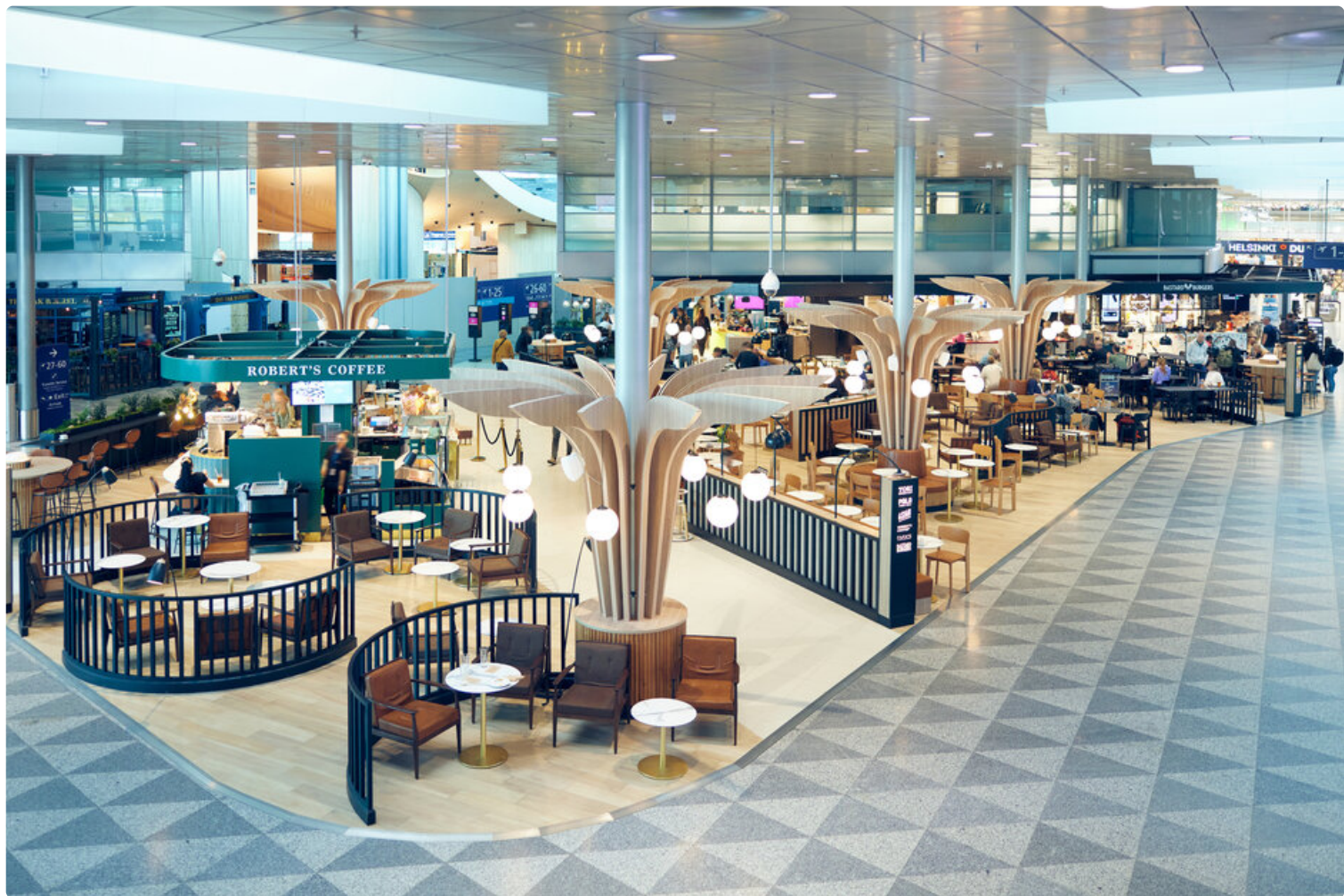
Helsinki-Vantaan lentoaseman food court Schengen-porttialueella.