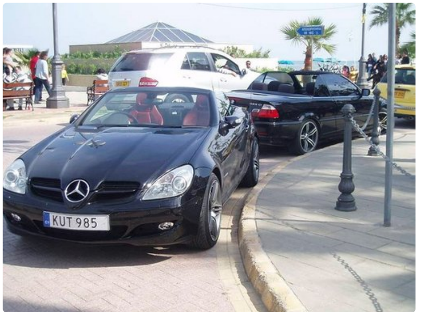
Larnacan rantabulevardin helmiä, jotka ovat viime vuosina tosin harvenneet taloudellisen laman seurauksena.