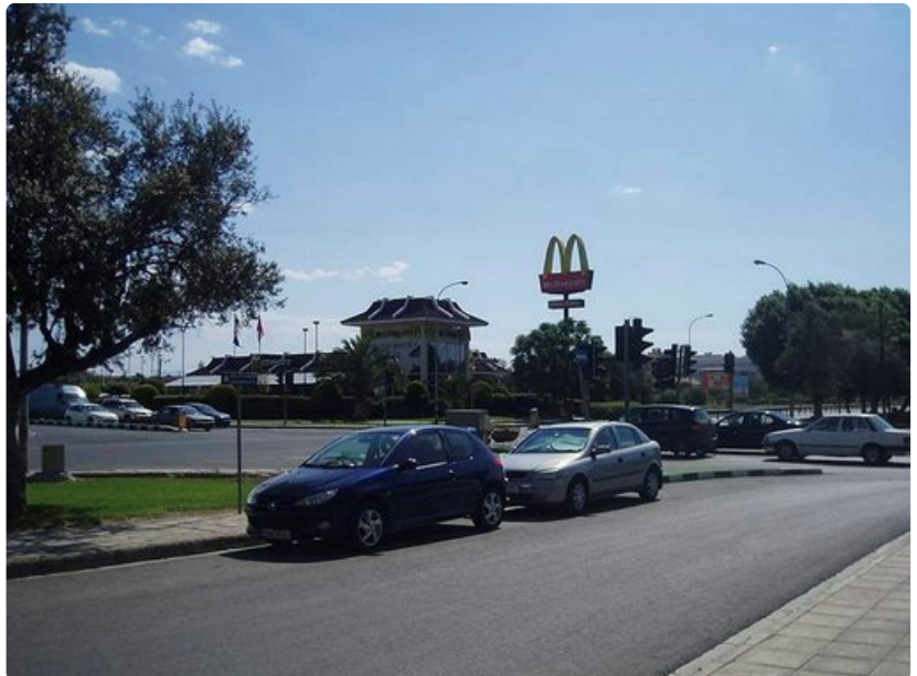
Drive-in McDonalds pääkaupunki Nikosian vilkkaassa risteyksessä.