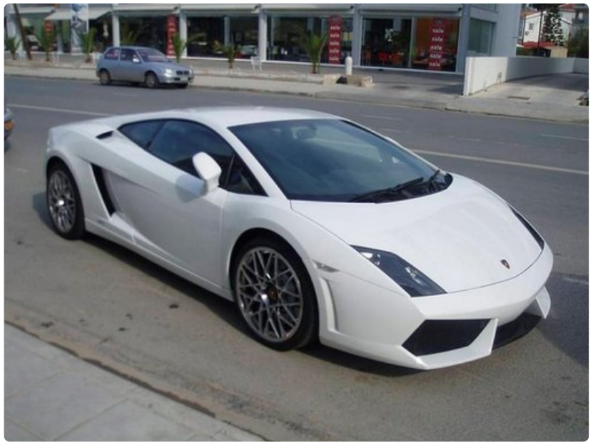
Moderni menopeli odottamassa omistajaansa ruokakaupasta ohituskaistalla.