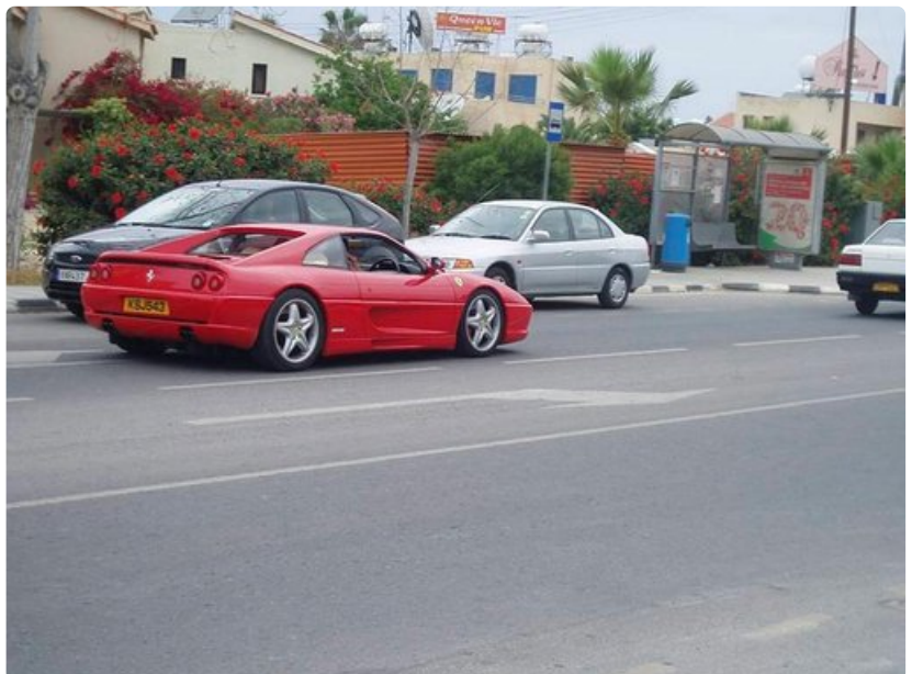
Ferrari on paikallisbussia yleisempi näky Kyproksen liikenteessä.