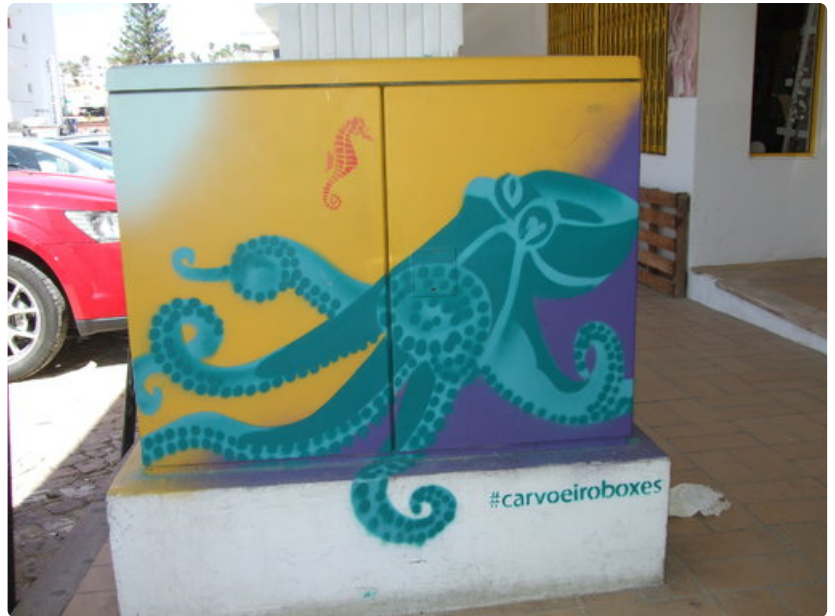
Paikallinen luonto on katutaiteilijoiden ensisijainen inspiraation lähde.