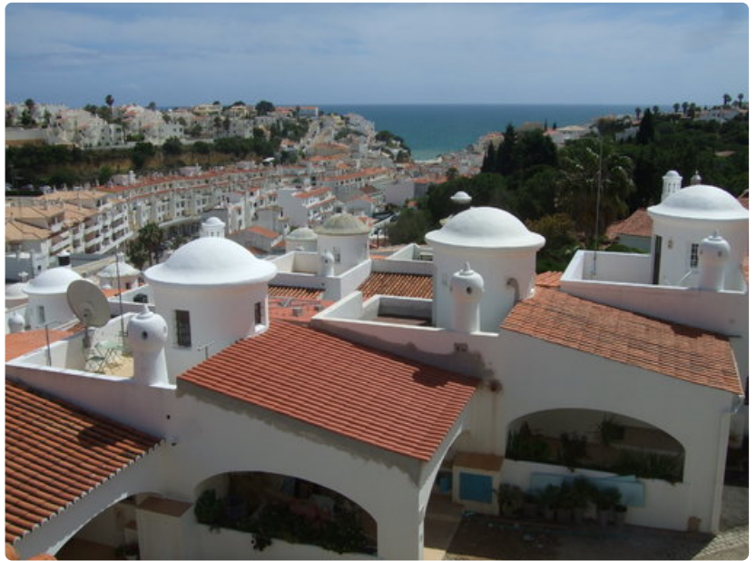
Apartmenton parvekkeelta näkymä Carvoieron keskustaan. Valkoisissa torneissa on kierreportaat huoneiston ylemmille aurinkoterasseille. Etäällä mainingin vaahtopää lyö kalliohalkeamaan syntyneelle biitsille. *