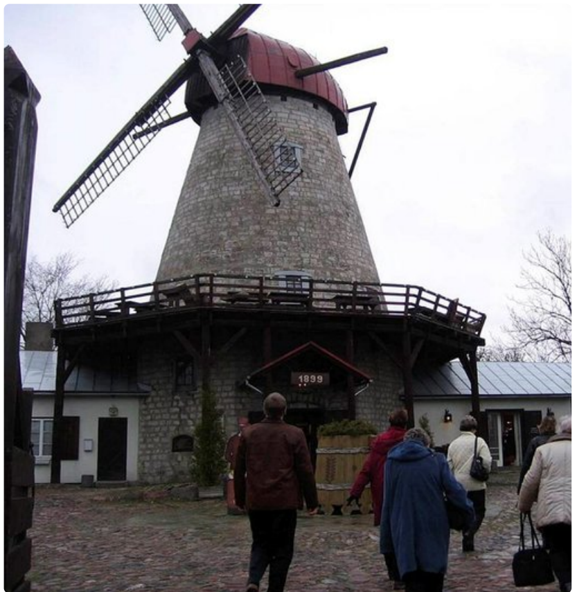
Vanhassa tuulimyllyssä keskellä Kuussaaren kaupunkia sijaitsee suosittu perinneruokaravintola.