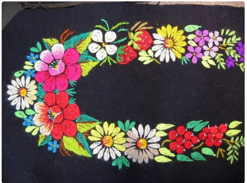
Opettaja toi Muhun tossun aiheen kirjantomalliksi.

o matkailupalveluja on vähän kaupungin ulkopuolella