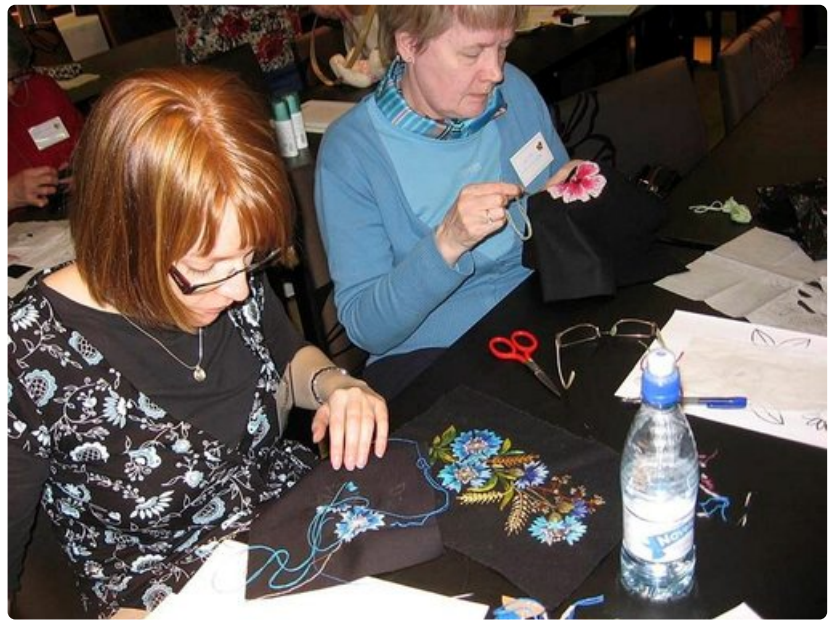
Ruiskukat ja viljan tähkät siirtyvät kankaalle kurssilaisten osaavissa käsissä.