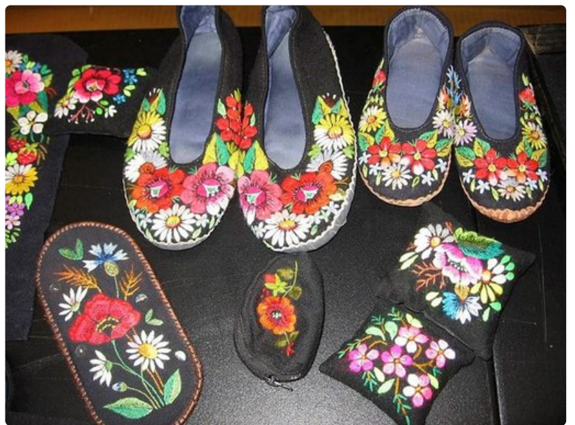
Opettajat toivat tossuja, silmälasikoteloita ja neulatyynyjä näytteiksi Muhumaan kirjonnasta.