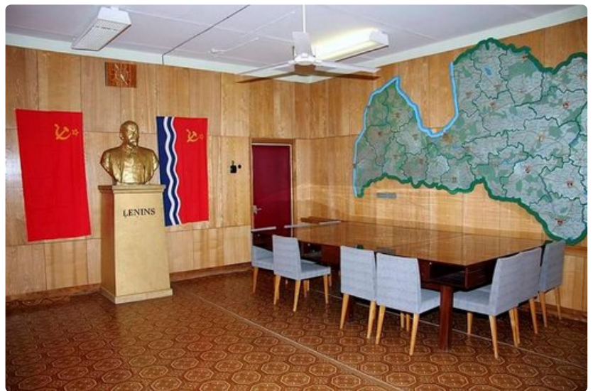
Jotta kokoushuoneen seinälle saatiin Latvian suurikokoinen kartta, se piti ryöväitä maatalousministeriöstä. Tosin se on maan kolhoosikartta, josta löytyy sellaisia kolhoosien nimiä kuten "Leninin Kipinä" ja "Punainen Nuoli".