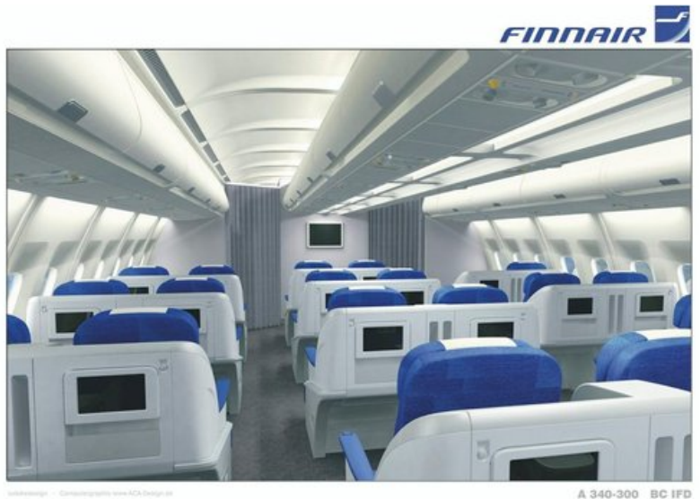
A 340-300 BC IFD