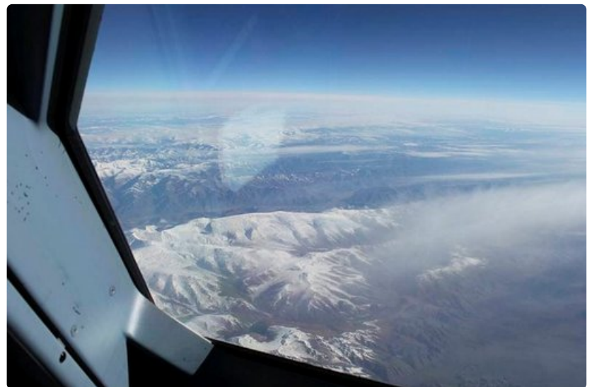
Kaukana kottikenttä, alla Venäjän ja Mongolian vuoret.

Ohjaamoon saadaan datalinkillä muun muassa sää kohdekentältä. Tässä näyttö kertoo sään klo 05.34 GMT-aikaa. Käytössä on kiittotie 07 vasen. Tuulen voimakkuus ja suunta 110 astetta 18 solmua (9 metriä sekunnissa). Näkyvyys on 10 km, vähän pilviä, 2500 jalkaa. Lämpötilä 33 astetta ja kastepiste 22. QNH (ilmanpaine) 1007 hPa.