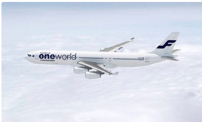
Kirjoittaja seurasi, mitä kaikkea liittyi lentoon Airbus 340 -tyypin koneella Helsingistä Hongkongiin.