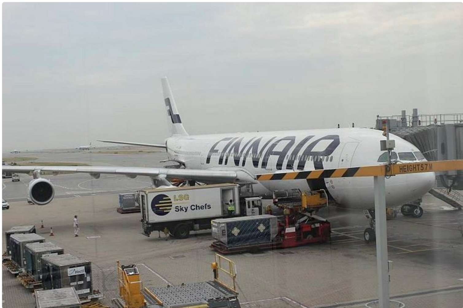
Matka Aasiaan tehtiin nelimootorisella koneella. Finnairin laivasto on siirtynyt kaksimootorisiin.