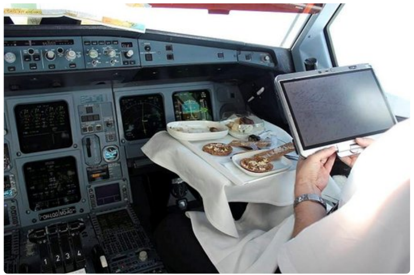
Ohjaamossa kapteeni ja perämies nauttivat aina erilaisen aterian.

Vuoriston päällä konetta ei voi tuupata alaspäin mihin suuntaan tahansa, kun lähistöllä saattaa olla jopa 7000 metrin korkuisia huippuja, kuten Himalajalla on.