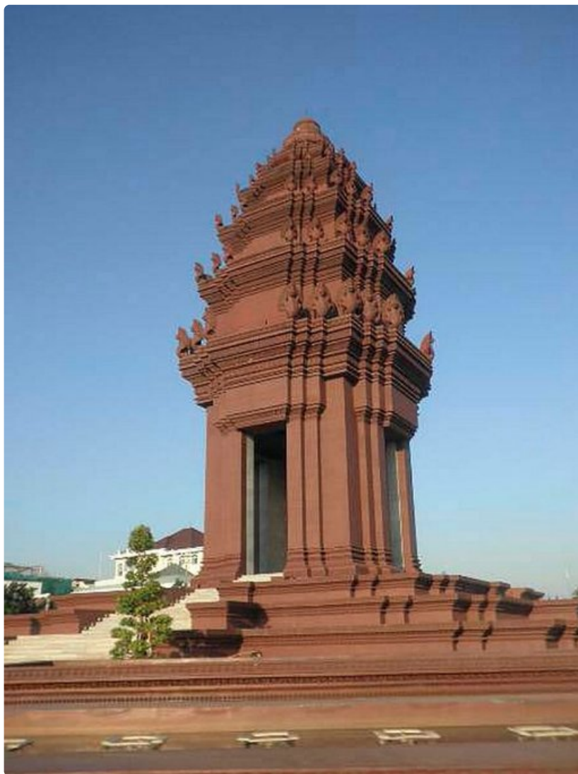
Independence Monument, Phnom Penh

Matka Sihanoukvillestä Siam Reapiin taittui mukavasti yöbussilla, joskin matka kulki Phnom Penhin kautta. Siam Reapissa sijaitsevat hindutemppelit Angkor Wat ja Angkor Tom ovat yli 900 vuotta vanhoja. Tempelialue on yhdeksän neliökilometrin laajuinen ja rakennusmenetelmät ovat alkeellisista työkaluista huolimatta olleet nerokkaita. Suurimpien rakennusten katolla kasvaa jopa puita. Tempelit rakennutti kuningas Suryavarman II.