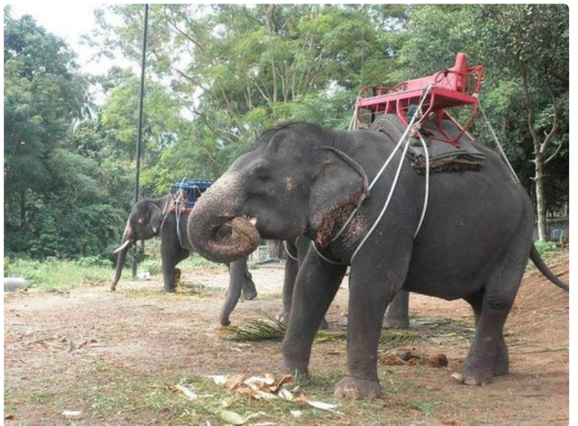
Elefanttikyyti Koh Samuilla.