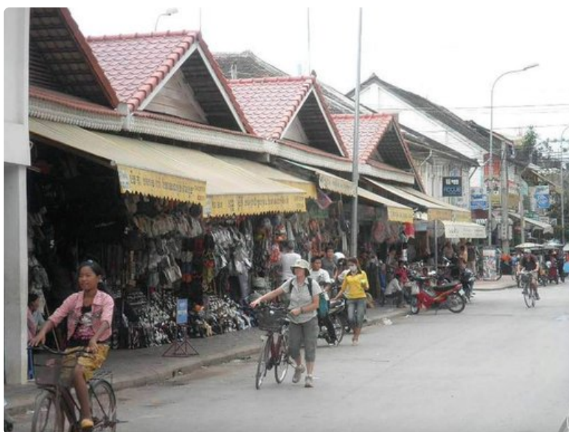
Siam Reapin torialuetta.