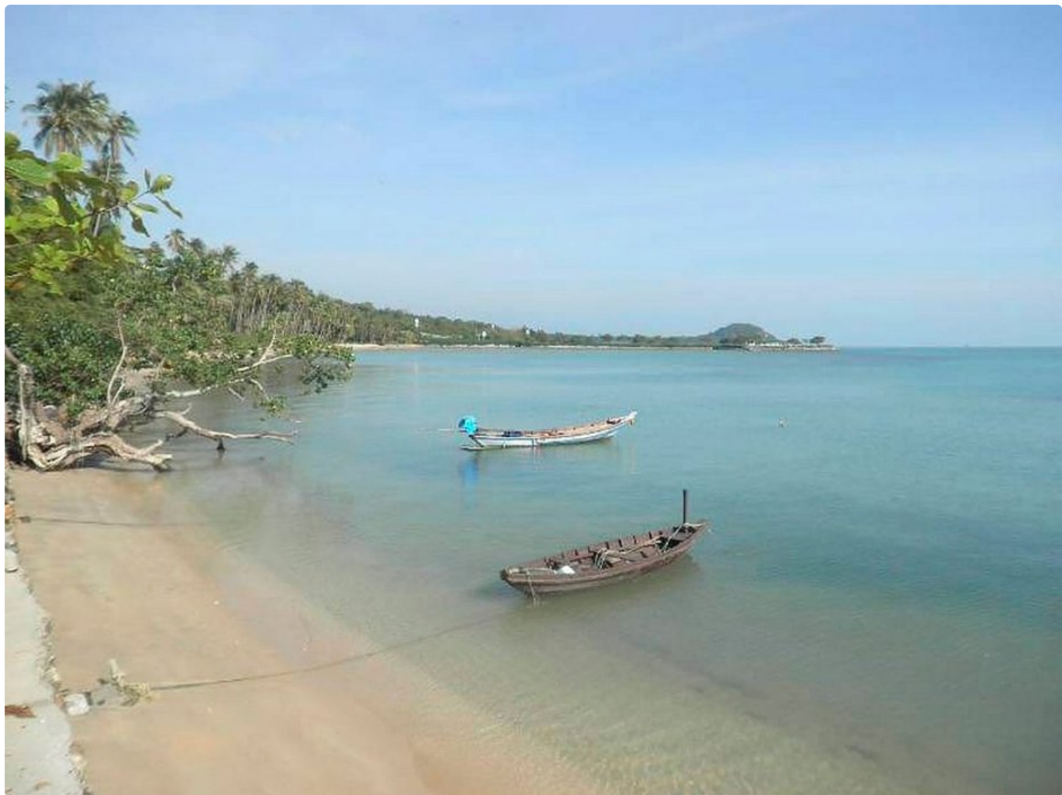
Koh Samuin autoita rantoja.