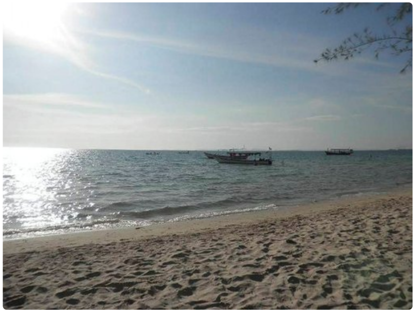
Sihanoukvillen asumaton hiekkarantaa.