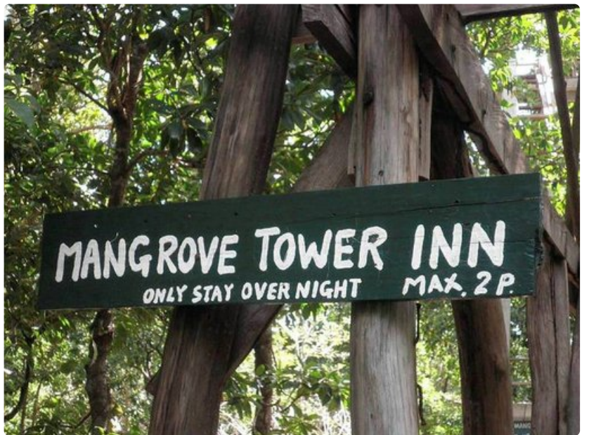
Majoitusta Sihanoukvillen mangrovemetsässä.