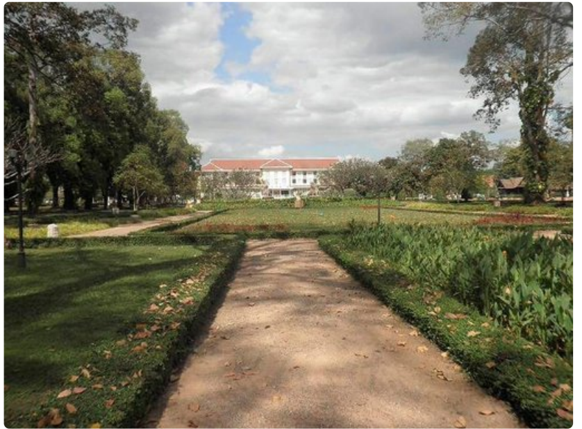
Kuninkaan asunto Siam Reapissa.