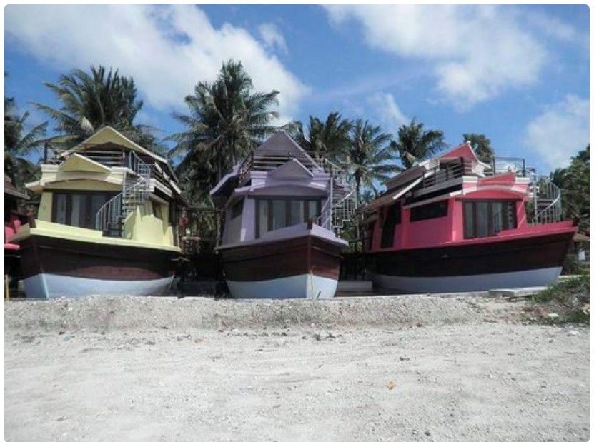
Asuntolaivoja Koh Panangilla.