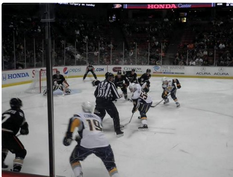
Anaheim Mighty Ducks-Boston -jäähkiekko-ottelu.