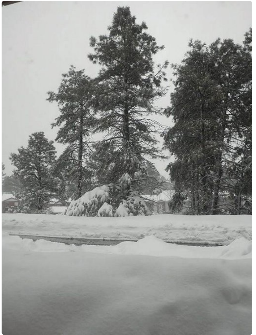
Lumi yllätti Flagstaffissa Arizonassa.

Suoraa Meksikon-lentoa ei ollut tarjolla, joten matka jatkui Floridan kautta. Miamissa sopi ihailla myös Suomessa pyörineen C.S.I. Miami -sarjan maisemia. Samalla kävin myös Orlandossa tutustumassa Cape Canaveralin avaruustutkimuskeskuksen. Sitten matka Key Westiin ja siellä olevasta Pohjois-Amerikan eteläkärjestä on vain 90 mailia Kuubaan. Mansikka-jäämurska-votkamargheritalla voi kunnioittaa kirjailija Ernest Hemingwayn muistoa, Hemingway asui ja kirjoitti Key Westin satamakaupungissa.