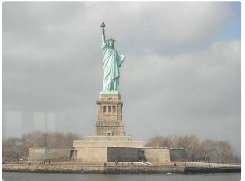
Vapaudenpatsas, New York.