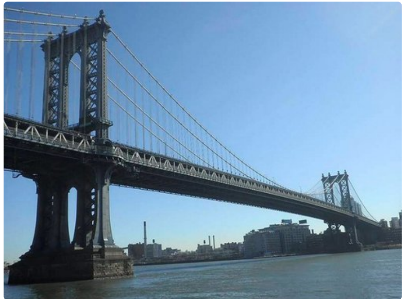
Brooklyn Bridge, New York City.