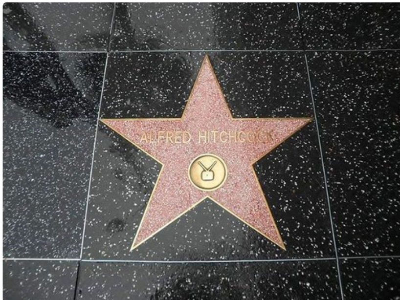
Alfred Hitchcockin tähti Walk of Famella.