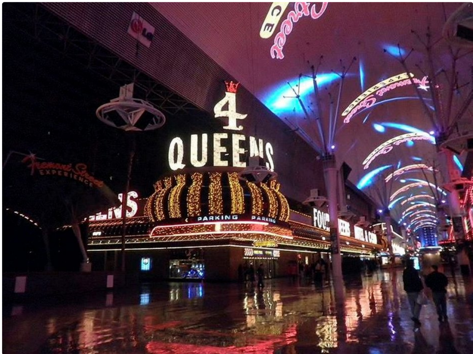
Kasino 4 Kuningatarta Las Vegasissa.