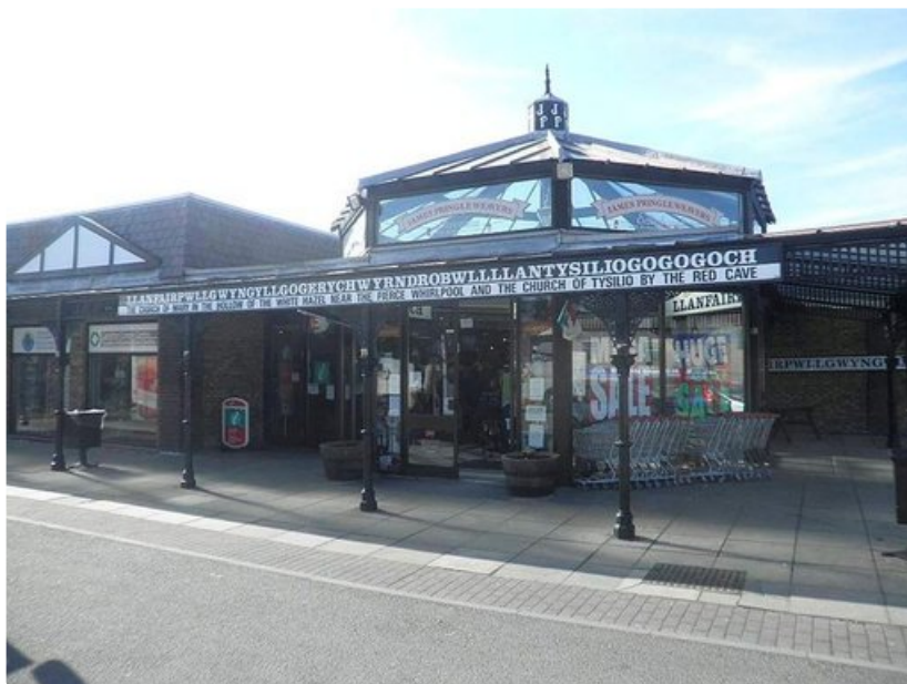
Maailman pisin aseman nimi Walesissä.