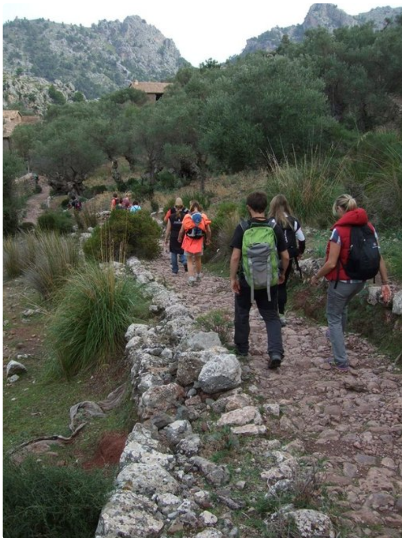
Port de Sóllerin jälkeistä jyrkkää nousua seuraa kilometrien loiva laskuosuus.