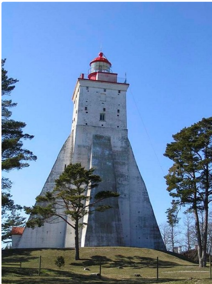
Köpun majakka on maailman kolmanneksi vanhin yhtäjaksoisesti toiminut tule torn.