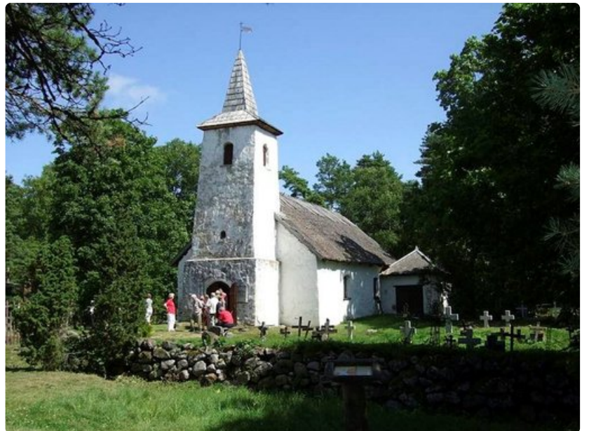
Metsän kätköstä löytyy tämä 1600-luvulta peräisin oleva Kassarin kappeli. Hautausmaan erikoisuus on kiviristit.