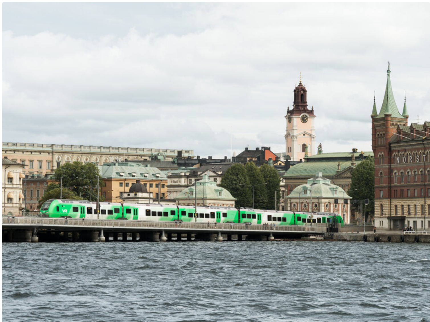
Ensimmäinen VR:n vihreä juna Tukholmassa.