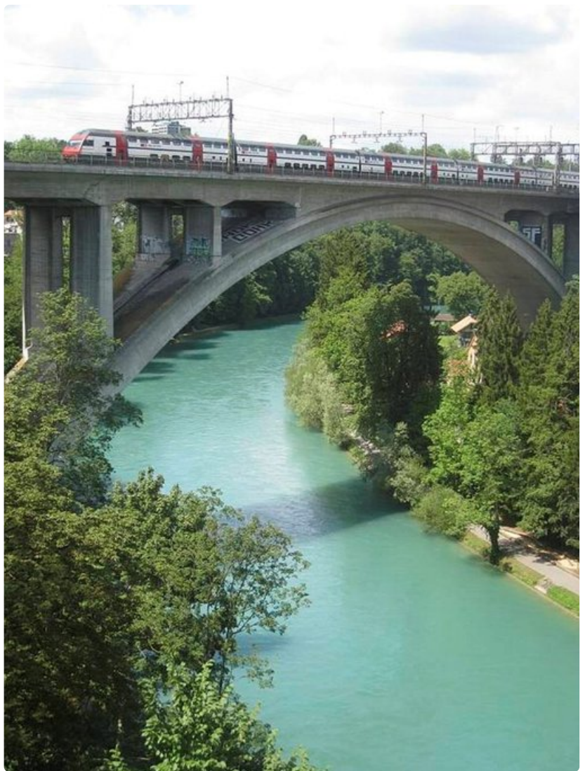
Pääkaupungin Bernin rautatieasemalle saavutaan ylittämällä Aare-joki korkeaa rautatiesiltaa pitkin.