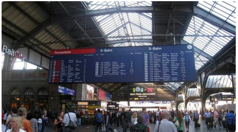
Zürichin päärautatieasema on yksi Sveitsin suurimmista.