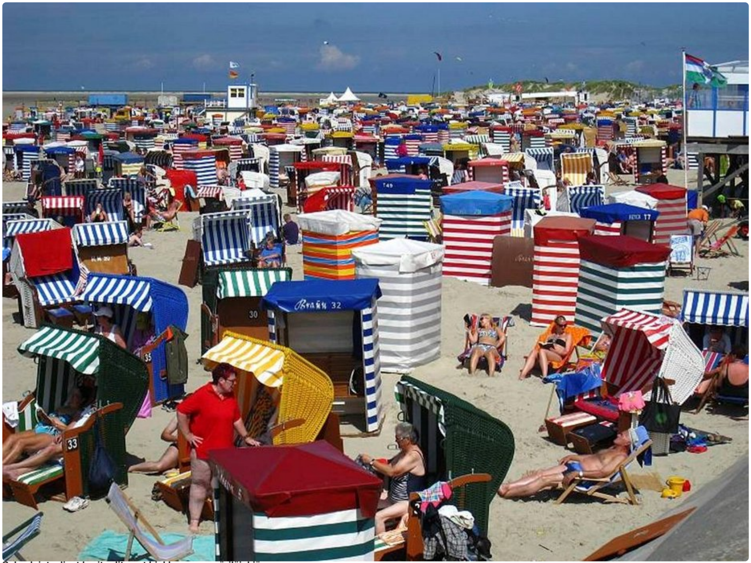
Saksalaistyylliset korituolit ovat hiekkarannan väriäiskä.