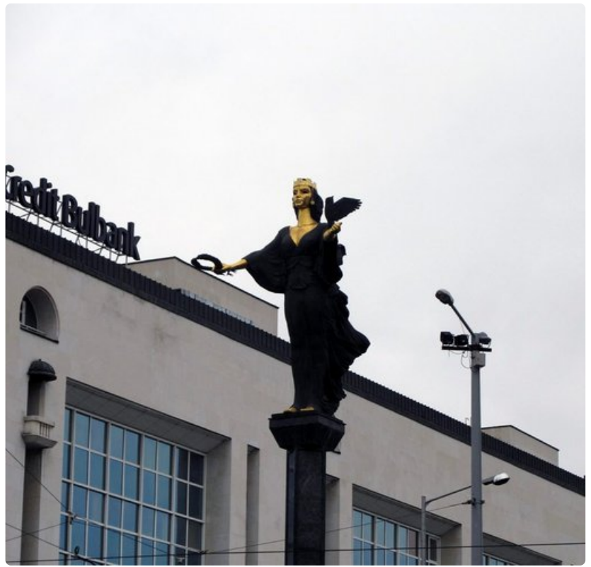
Niin katoaa maine kunnia. Kaupungin suojeluspyhimyksen patsas korvasi vuonna 2000 paikkaa ennen hallinneen Leninin.