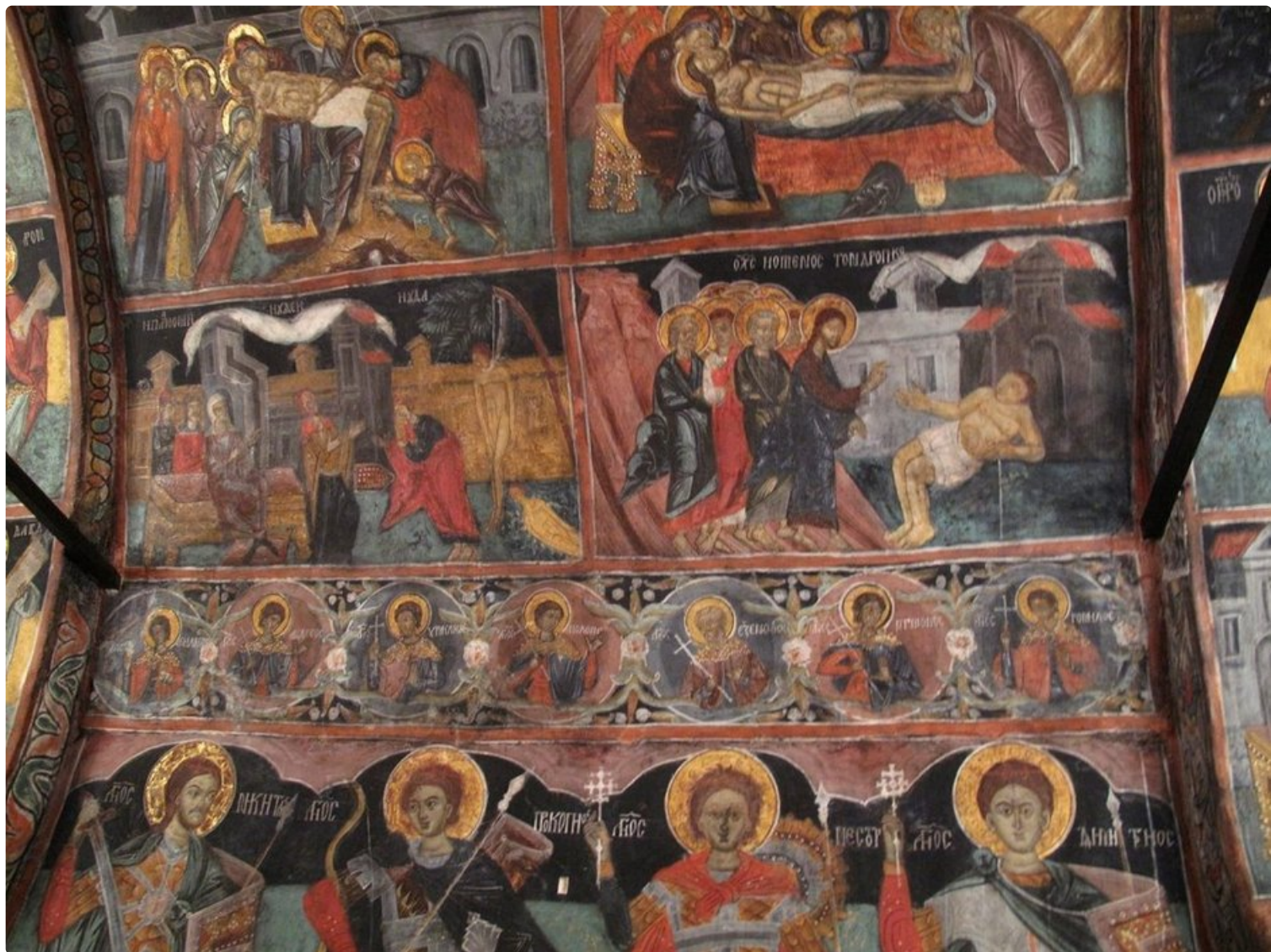
Arbanasin pienen kirkon värikkäät katto- ja seinämaalaukset välittävät harrasta tunnelmaa vuosisatojen takaa.