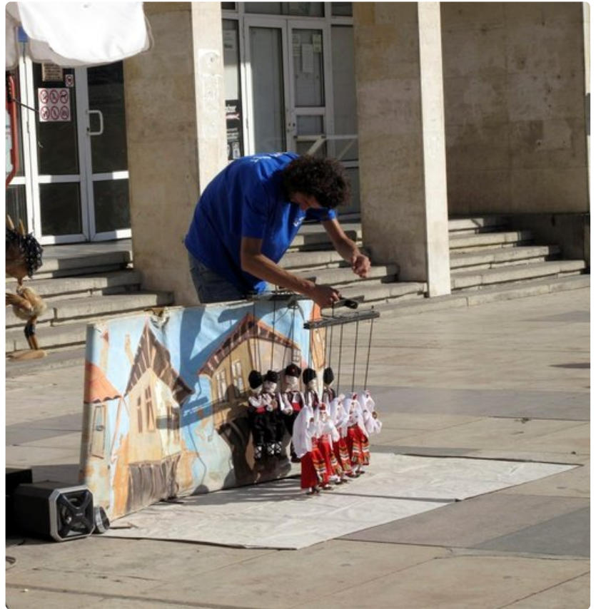
Marionettitaiteilija Plovdivin kävelykadulla hauskuutti yleisöään vauhdikkailta kansantanssiesityksillä.