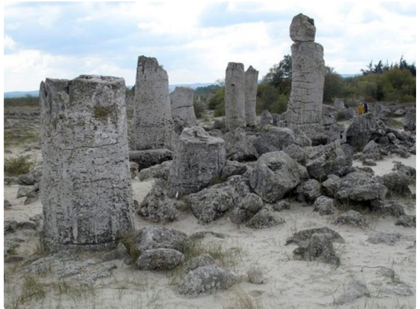
Kivetynyt "metsä" on peräisin 50 miljoonan vuoden takaa, jolloin alue oli vielä merenpohjaa. Kivimuodostelmat panevat kulkijan mielikuvituksen liikkeelle.