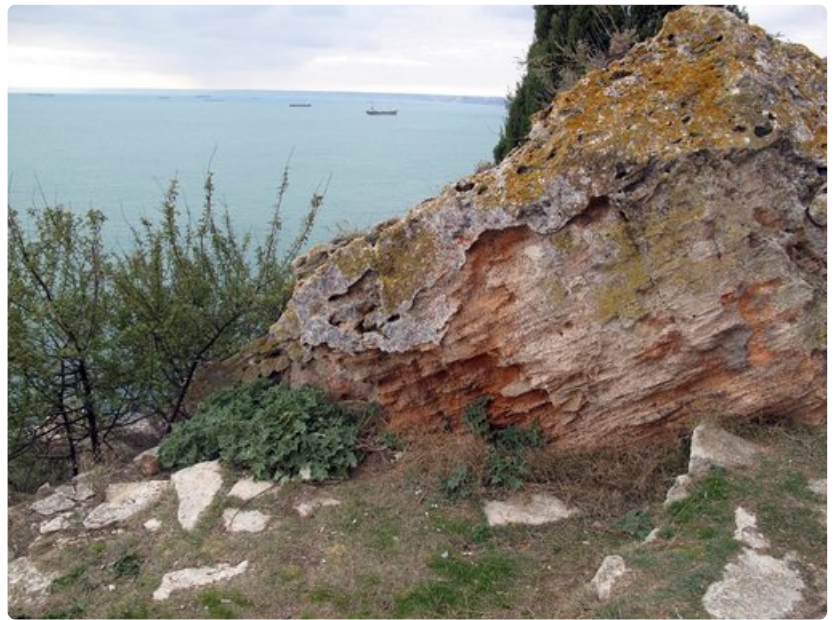
Kaliakran jylhät kalliot kurottavat pitkälle Mustallemerelle. Kallioilla oli ennen linnoitus. Nyt legendastaan tunnettu paikka on luonnonsuojeluetta ja muuttolintujen tärkeä levähdyspaikka.