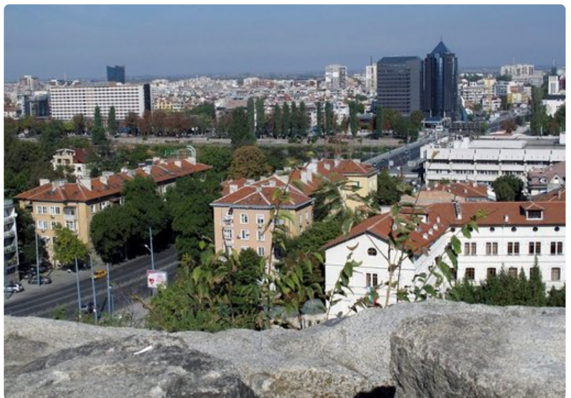
Kukkulalle rakennetun Vanhankaupungin linnoituksen muureilta on upea näköala nykyiseen Plovdiviin, Bulgarian toiseksi suurimpaan kaupunkiin.