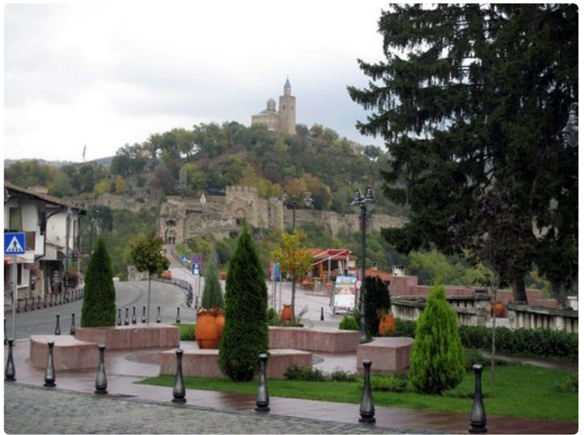
Bulgarian toisen valtakunnan pääkaupunkia, Veliko Tarnovoa, hallitsee edelleen Tsarevetsin vaikuttava linnoitus, jonka muureja on huolella restauroitu.