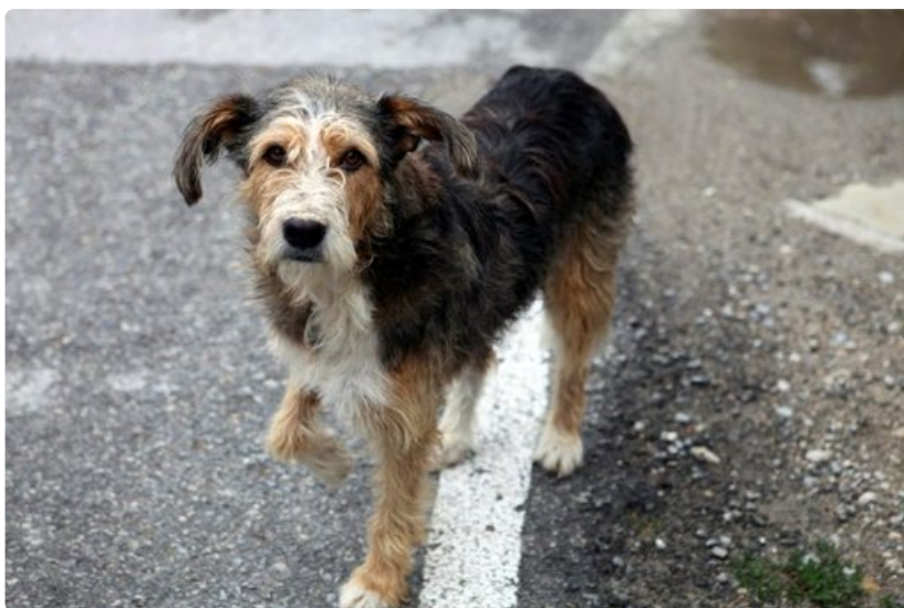
Useimmat kulkukoirat ovat ystävällisiä, kuten tämäkin Arbanasin kujilla kolmella jalalla nilkuttanut sympaattinen karvakuono.