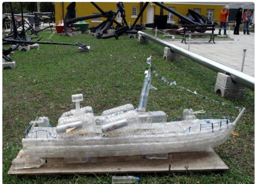
Merestä ja rannoilta kerätyistä muovipulloista 12-vuotiaan pojan rakentama laiva Varnan merimuseon pihalla muistuttaa merten saastumisesta ja erityisen haitallisesta muovijätteestä.