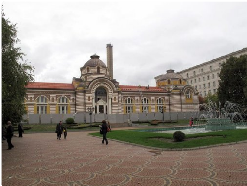
Sofian vanhaa ja rapistunutta julkista kylpylärakennusta on restauroitu jo vuosia ja työt alkavat olla loppusuoralla. Siitä on tulossa kulttuurikeskus.

o Matkailuvinkkejä saa osoitteesta www.bulgariatravel.org o Bulgaria ei kuulu Schengen-alueeseen, joten passintarkastukseen kentillä pitää varata aikaa.