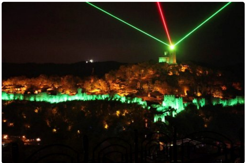
Historian myrskyisät vaiheet käydään läpi matkailijaryhmille Veliko Tarnovossa järjestettävässä näyttävässä ääni- ja valoshow'ssa.