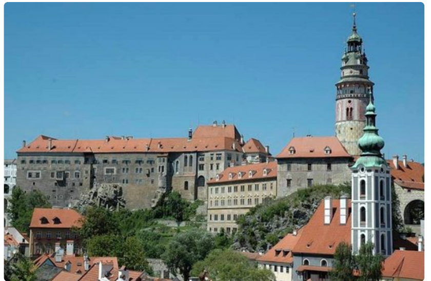
Krumlovin linna sekä vanha ja uudempi kirkko nousevat kaupungin yläpuolelle.