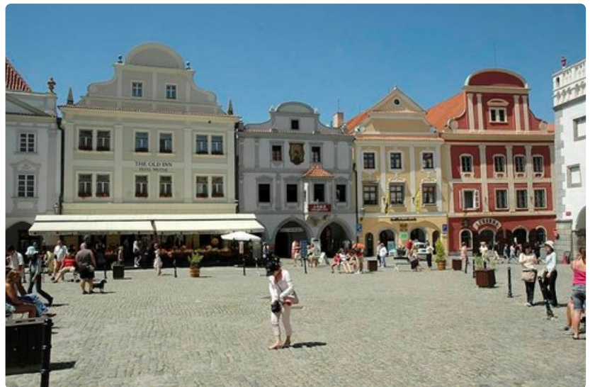
Kaduilla ei ole tungosta edes sesonkiaikaan.