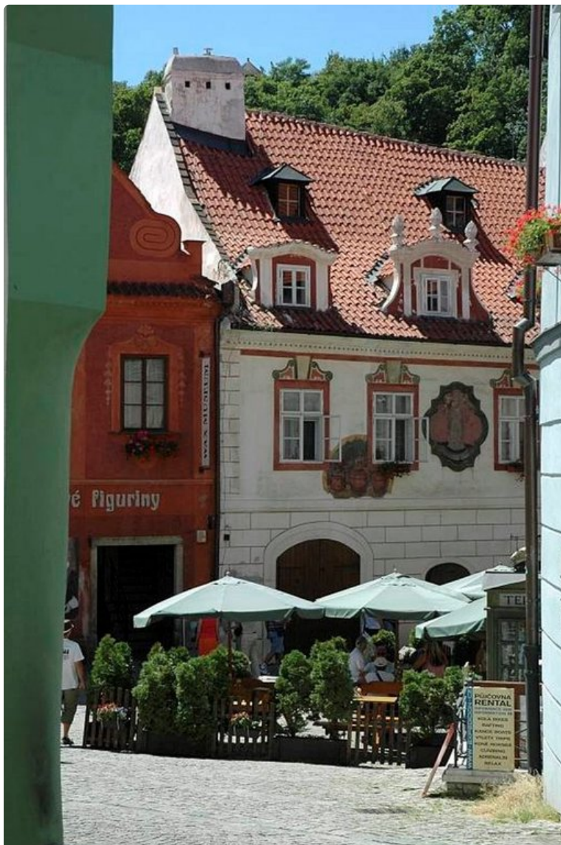
Pienen torin terassilla nautitaan virvokkeita varjossa.

Majoitus: Paljon vaihtoehtoja, edullisimmillaan vuorokausihinta 30 eurosta alkaen.