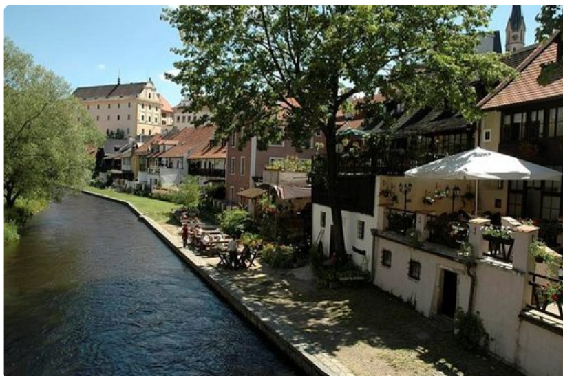
Vltava-joen sivuhaaraa pitkin pääsee Prahaan.