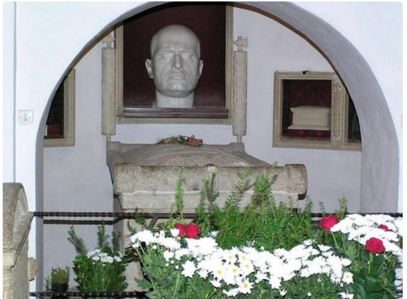
Benito Mussolinin hauta Predappion San Cassianon hautausmaalla on matkailunähtävyys ja kulttipaikka.