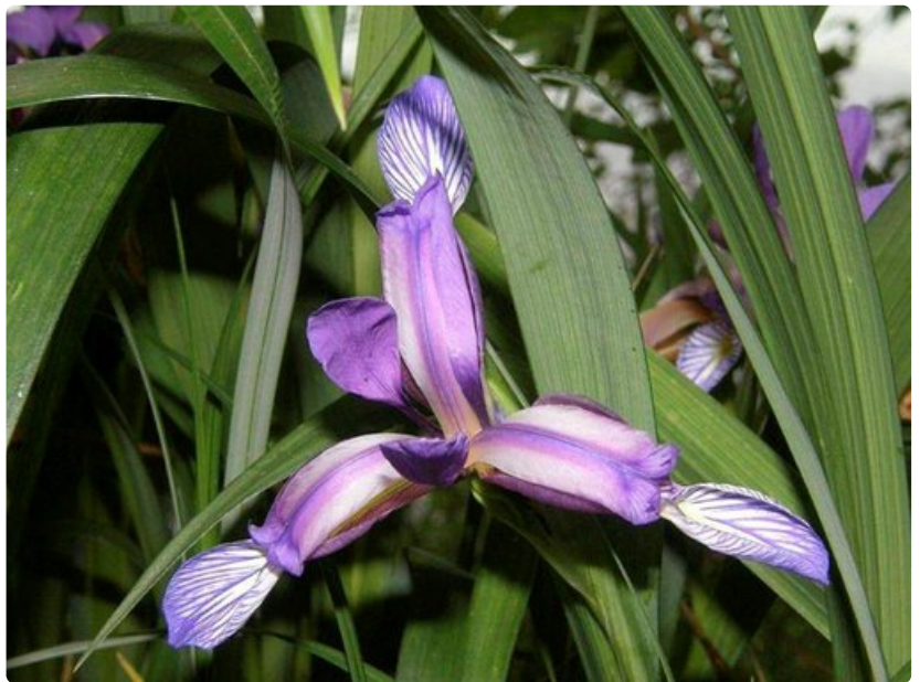
Kauuniit irikset loistavat väripilkkuina vihreyden keskellä.

Kroatian rannikko on upea, mutta vierailijan kannattaa tutustua myös sisämaahan. Maaseutu on kaunista ja Plitvicka-järvet kruunaavat matkan. Plitvickan kansallispuiston kaltaista järvimaisemaa ei löydy muualta Euroopasta. Suosittelen lämpimästi.