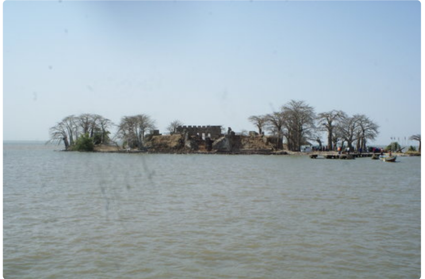
Tältä saarelta orjat kuljetettiin Amerikkaan. Muun muassa Kuntah Kinte on täältä astunut laivaan. Nyt saari on Unescon maailmanperintökohde.