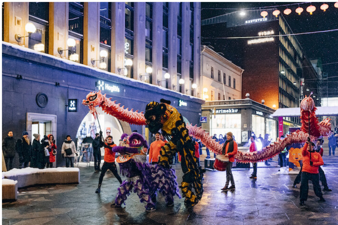
Kiinalaista uuttavuotta juhlittiin Keskuskadulla myös viime vuoden tammikuussa.