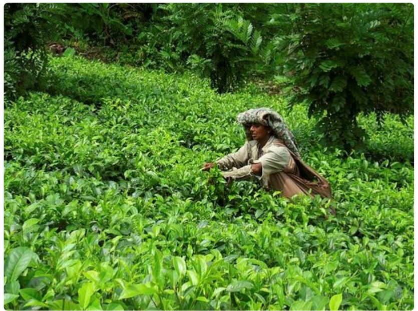
Hikkaduwalta voi vierailulla lähistön teeplantaaseilla tai vaikkapa Yalan kansallispuistossa.