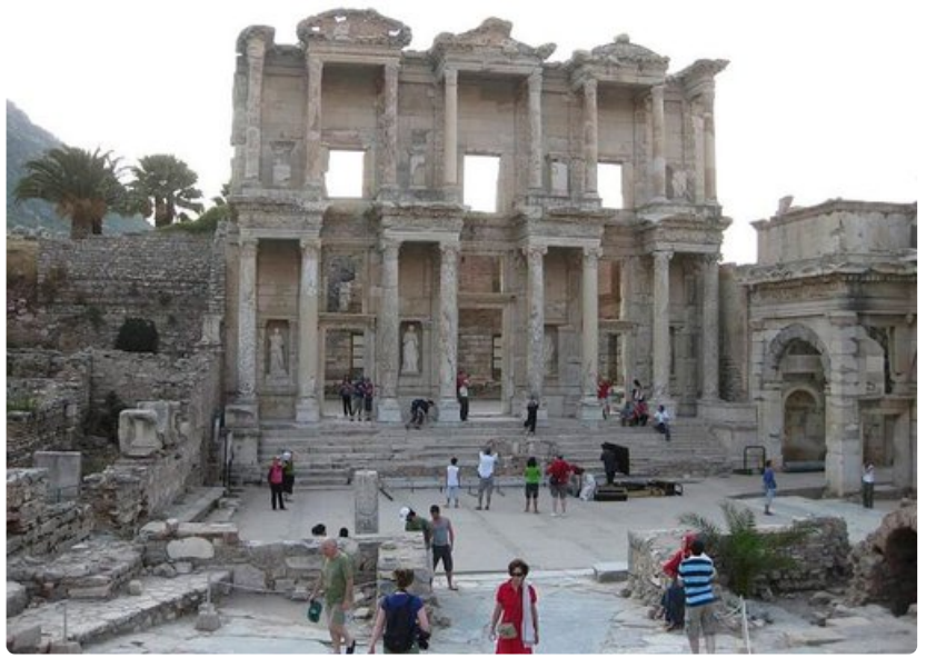
Efesoksen kirjasto oli aikanaan maailman kolmanneksi suurin ja merkittävin heti Aleksandrian ja Pergamon jälkeen.