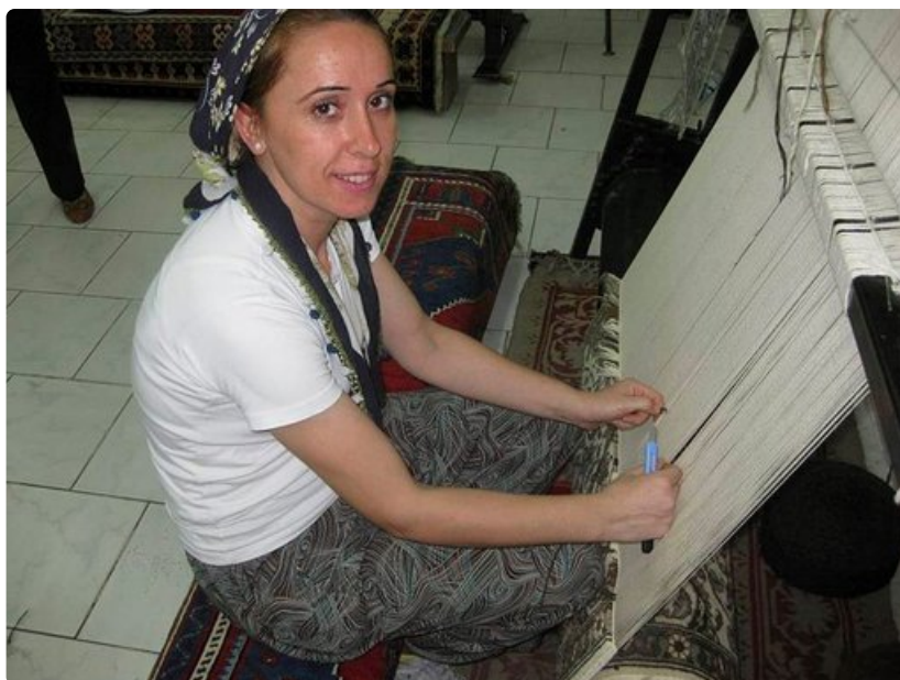
Aito matto on käsityön mestarinäyte.