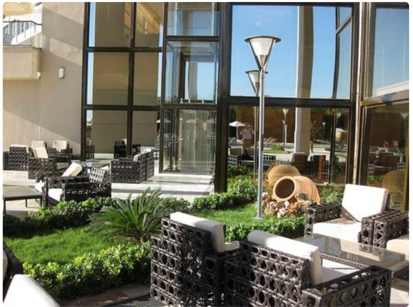
Izmirissä on hyvät hotellit ja hyvä ilmasto.