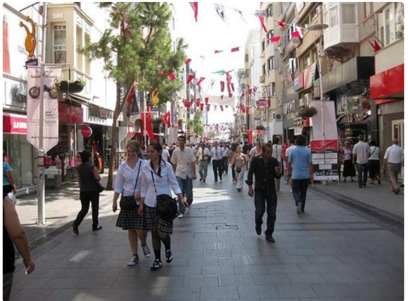
Ostoskaduilla ei ole taskuvarkaita.