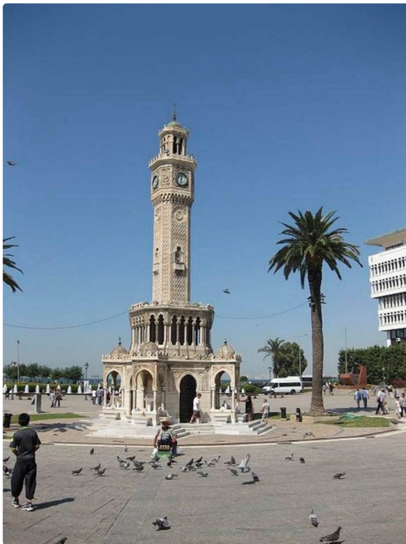
Izmirin symboli on vuonna 1901 rakennettu kellotorni, johon kellon on lahjoittanut Saksan keisari Wilhem II.

Muuta: Turkki on Euroopan Neuvoston, OECD:n, ETYJ:n ja NATO:n jäsen. Vuodesta 2005 käynyt neuvotteluja EU:n täysjäsenyydestä. Kuuluu G20 -ryhmään, maailman suurimpien talouksien joukkoon.