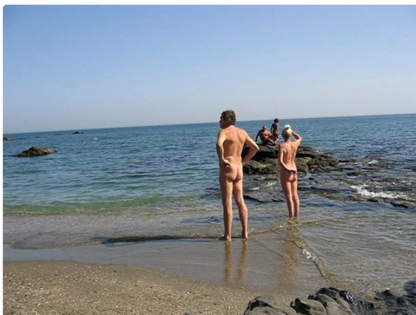
Nudistimatkailu kasvaa eri puolilla maailmaa.