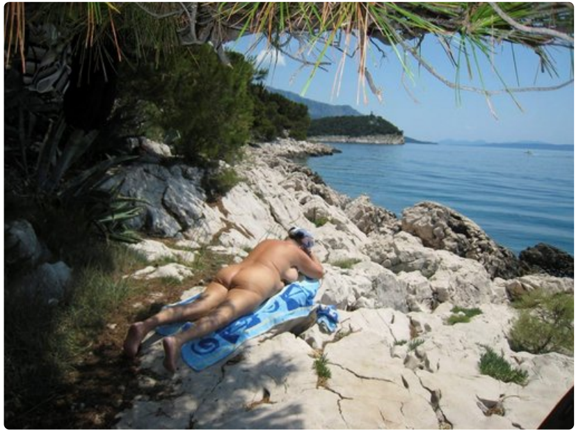
Kroatista sanotaan lähteneen maailmalle sekä kravatti että naturismi. Kuva nudistirannalta Makarskassa.