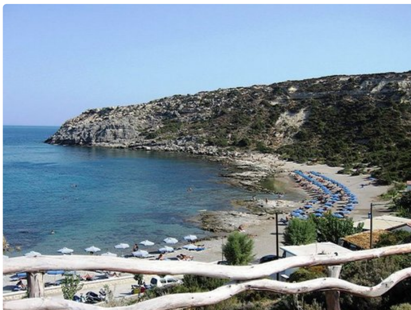
Espanjan saarilla voi käyskennellä alasti vaikka dyyneillä ja jopa Kreikan Rodoksen saarelta löytyy nudistirantoja.