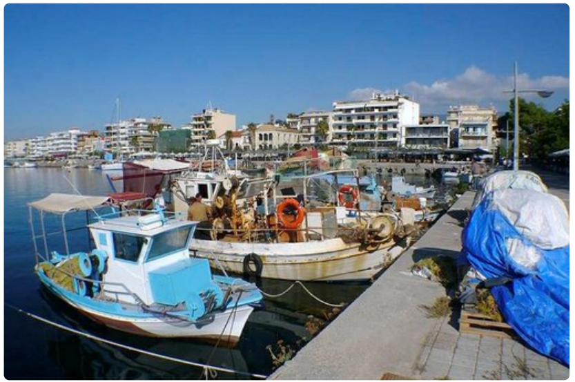
Kalastajaveneet odottelevat Kalamatan satamassa seuraavan yön saalistusretkeä.

Vuoristoisella seudulla jo 50 kilometrin ajomatkaan kuluu tunnista puoleentoista.