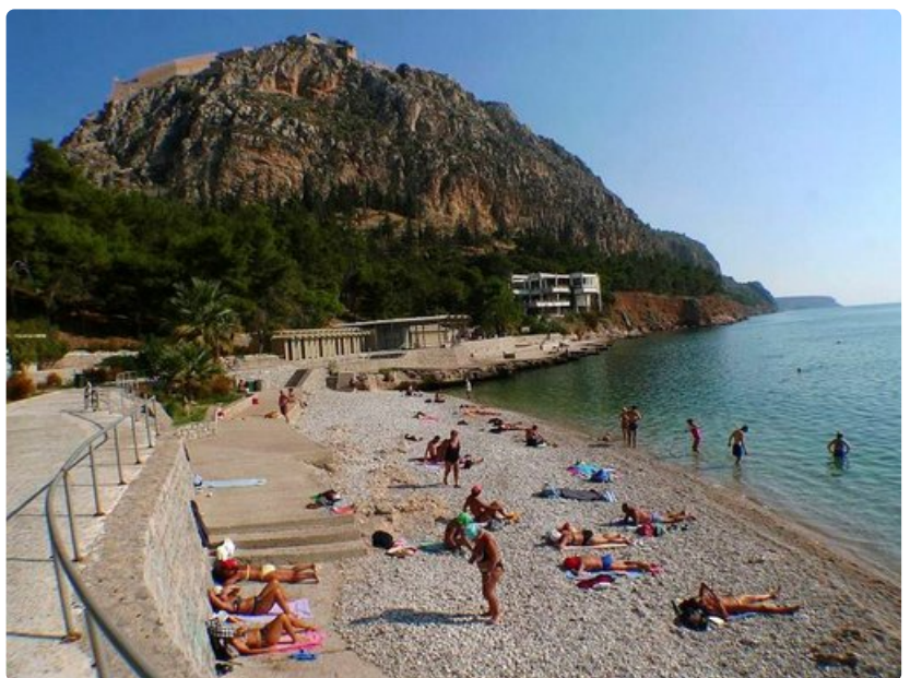
Yli 200 metrin korkeuteen yltävä linnoitusvuori suojaaa Nafpliosin kirkasvetistä Arvanitia-uimarantaa. Kaupungin keskustan läheisyyden ranta on erityisesti vanhempien ihmisten suosiossa.