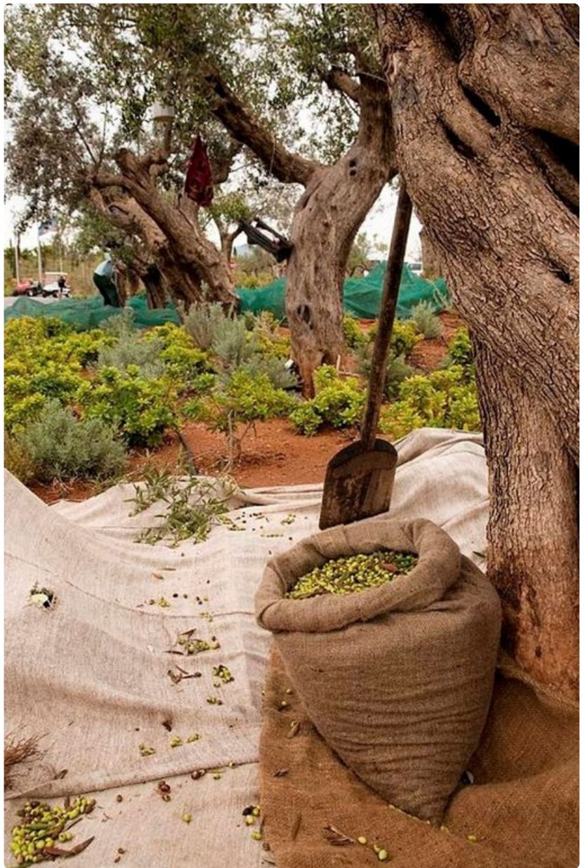
"Vihreän kullan" sadonkorjuu on käynnissä. Peloponnesoksen alueella kasvavat maailman parhaat oliivit - näin sanotaan. Kalamatan oliiveilla on jopa EU:n nimisuoja.

Agios Nikolaoksen viehättävässä kalastajakylässä söimme kevyen lounaan. Haaveilimme kala-ateriasta, mutta kun kokonainen kala maksaa 40-50 euroa kilolta, kalalounas jää väliin. Meret on kalastettu vähiin ja kalan hinta on noussut pilviin.