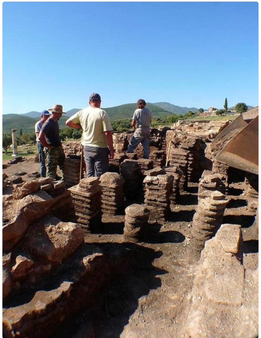
Työmiehet kaivavat esiin Antiikin Messiniassa kylpylän "tulipesän" mustuneita raunoita.