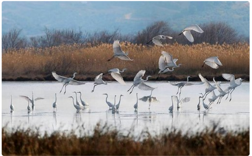
Navarinolahden läheisyydessä Gialovassa sijaitsee suuri vesialue, jossa on 270 eri lintulajin joukossa lamingoja.