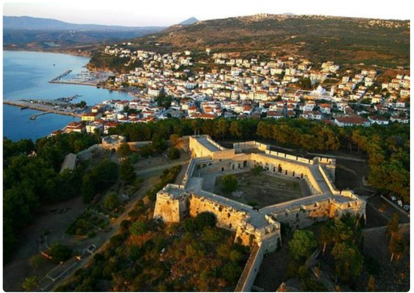
Niokastro-niminen turkkilaisten 1500-luvun loppupuolella rakentama linnoitus vahtii Costa Navarinon lahden rannalla sijaitsevaa Pylosin kaupunkia.