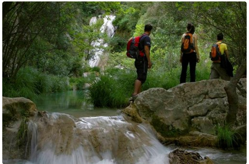
Peloponnesoksella on paljon vaihtoehtoja aktiiviseen lomailuun. Patikoijille on tarjolla upeita reittejä jokineen ja vesiputouksineen.