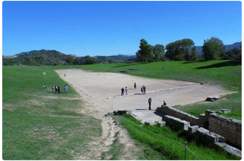
Tällä 212,5 metrin pituisella ja 28,5 metriä leveällä Olympian entällä taisteltiin muinoin kunniaa rahasta. Lajeina olivat muun muassa juoksu, paini, nyrkkeily ja viisiottelu. Katsomoon mahtui 45 000 ihmistä ja vain miehet saivat osallistua alastomina.