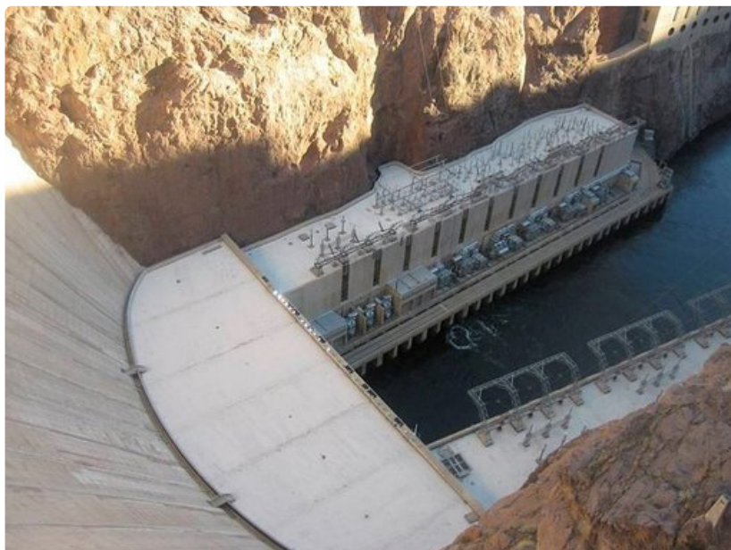
Voimalaitoskenttä on yli 200 metriä vesipinnan alapuolella.

Rantaviivaa: 885 km Kapasiteetti: 35 biljoonaa m 3 Suurin syvyys: 149 m Pinta-ala: 640 km 2 Pituus: 190 km