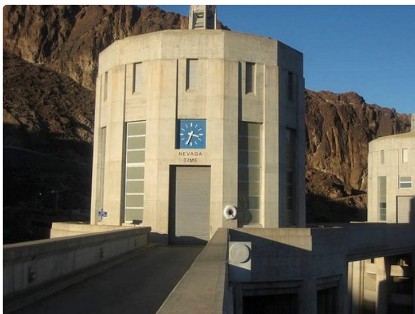
Hooverin padon alueella eletään niin Nevadan kuin Arizonan osavaltioiden aikaa.