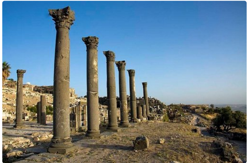
Jordaniassa on lukematon määrä antiikinaikaista arkkitehtuuria.

Aavikon luotetuin kulkuväline on kameli. Näiden kyhmysekkien kanssa on Jordaniassa mahdollista matkustaa lähes joka kolkkaan. Esimerkiksi erinomainen kameliretki on Wadi Rum kanjonien ja vuorten keskellä, missä voi yöpyä perinteisissä beduiiniteltoissa ja oppia näiden paimentolaisten kulttuurista ja elämäntyylistä. Vaihtoehtoisesti alueeseen voi tutustua kuumailmapallon kyydissä. Jos aavikkonäkymät käyvät kuitenkin liian yksitoikkoisiksi niin Swamarin vihreillä savanneilla voi tutustua moniin Lähi-idän harvinaisemmista eläinlajeista. Näitä ovat muun muassa jättipitkistä sarvista tunnettu valkobeisa, gasellit sekä aasianvilliaasit. Jordanian-matkalla kannattaa käväistä myös Kuolleellamerellä. Se on varmasti yksi erikoisimmista kokemuksista, mihin voi elämänsä aikana törmätä. Vehreän Jordan-jokilaakson päässä sijaitseva meri