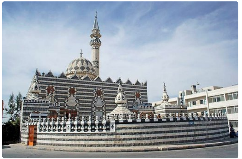
Abu Darweesh on Ammanin hienoimpia moskeijoita.