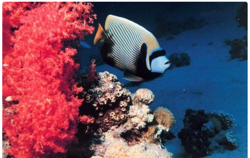
Punainen meri huokuu upeita värejä ja eksoottisia kalalajeja.