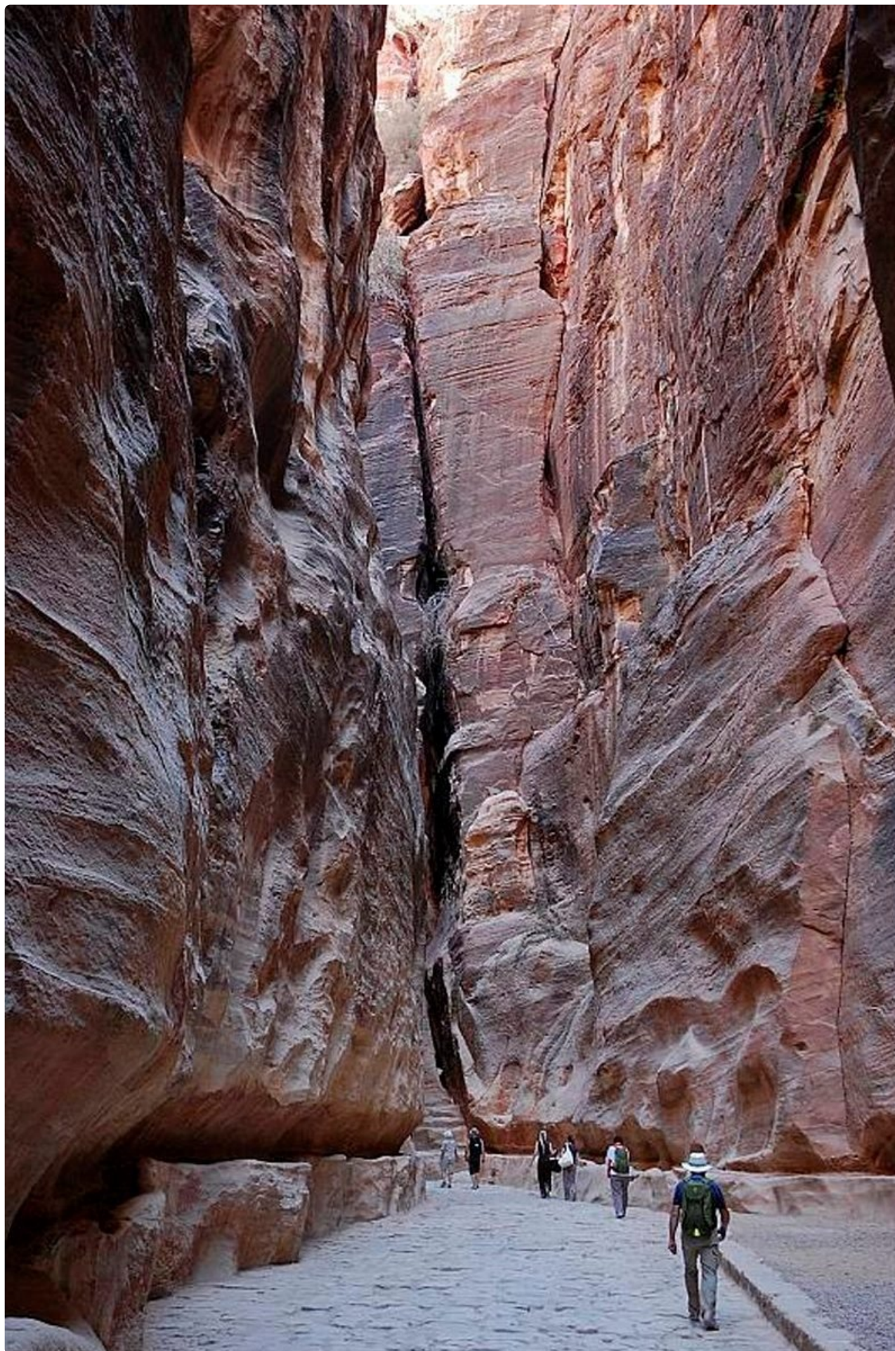
Jo Petraan vievä tie on henkeäsalpaavan majesteettinen.