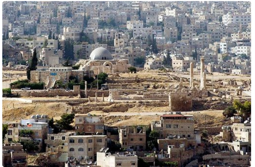
Amman on mielenkiintoinen sekoitus eri kulttuureja.