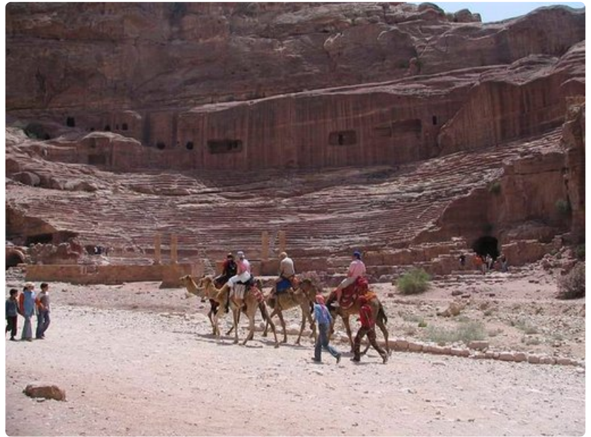
Kameliratsastus on suosittua. Petraan tutustuttaessa se on helpoin tapa liikkua kohteesta toiseen.

o Paikoittain Jordania voi olla hyvinkin kallis. Esimerkkinä on Petran historialliseen kaupunkiin perittävä sisäänpääsymaksu. o Päiväretket voivat olla todella pitkiä välimatkojen takia. o Jordaniaan ei kannata matkustaa yöelämän perässä.