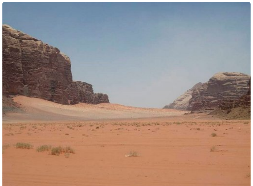
Wadi Rumin aavikkoalueet ovat värikkäitä.