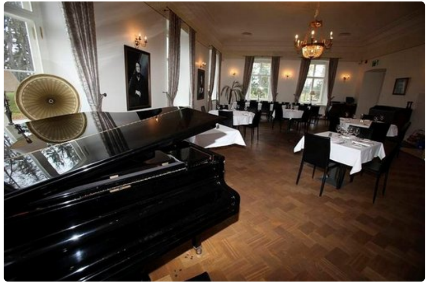
Tunnelmallinen ravintola on vuosisatojen saatossa ravinnut arvokkaita vieraita.