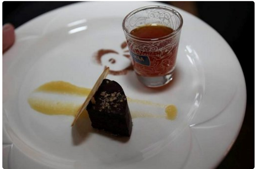
Viinaryyppy ja makeapala on Vihulan tavaramerkki.