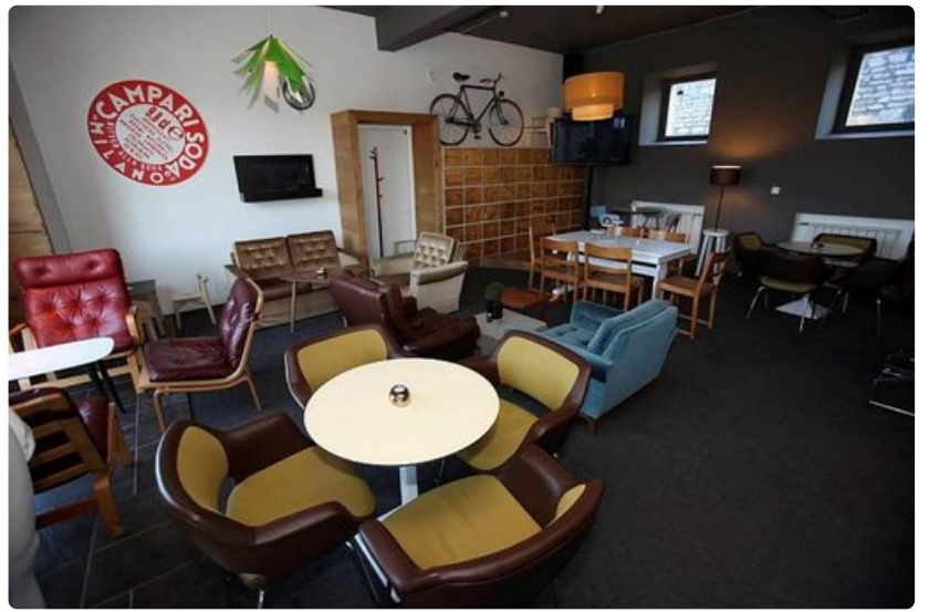
Kalamajan ravintoloissa on kierrätys ykkösasia.