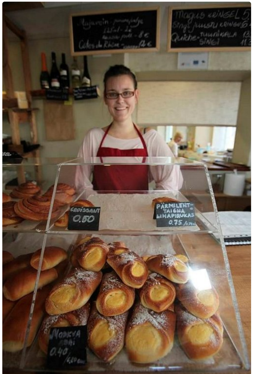
Kalamajasta löytyy herkkuja tarjoava konditoria.