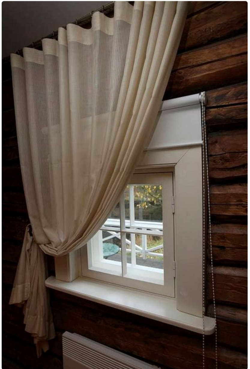
Vihulan kartanon idylliä morsiuksiin.