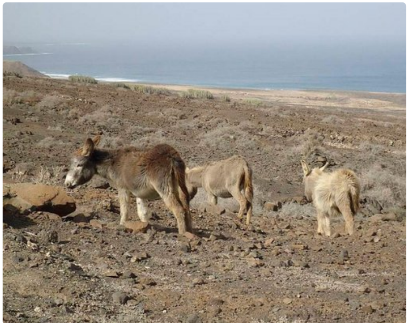
Jandian luonnonpuiston villiaasit löytävät toimeentulonsa äärimmäisen karusta maastosta.