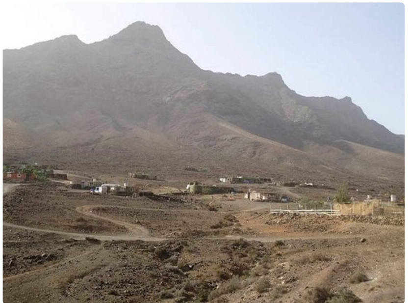
Fuerteventuran pohjoisrannikolla oleva Cofeten kalastajakylä edustaa primitiivistä kanarialaista asumista.