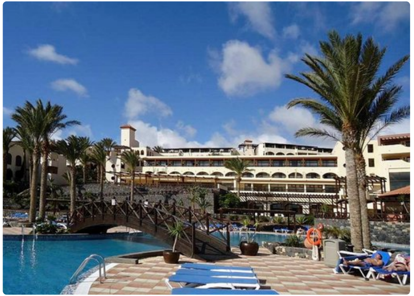
Fuerteventuran lomahotellit kestävät vertailun muiden aurinkolomakohteiden kanssa. Barcelo Jandia Mar -hotellin uima-allasaluetta.

Miten pääsee: matkanjärjestäjien valmismatkoilla, reittilennot edullisimmin Saksan kautta