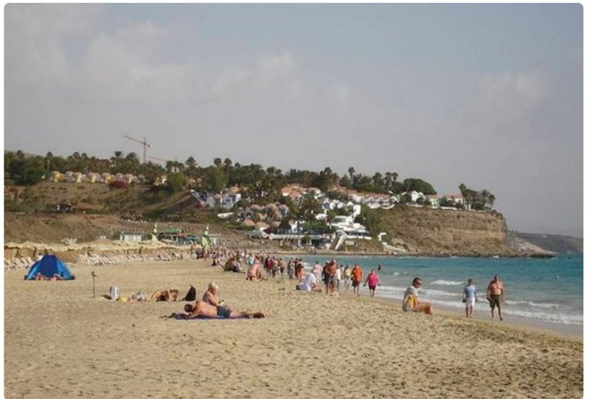
Jandian hiekkaranta on yksi Fuerteventuran suurimmista ja suosituimmista.