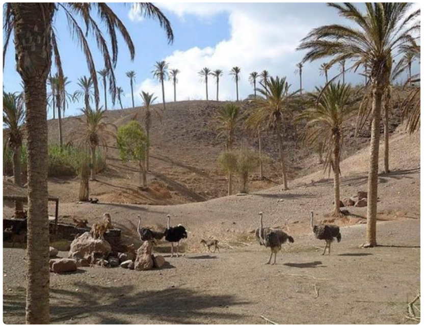
Oasis Parkissa tutustutaan Afrikan savannin eläimiin istutettujen palmujen katveessa.