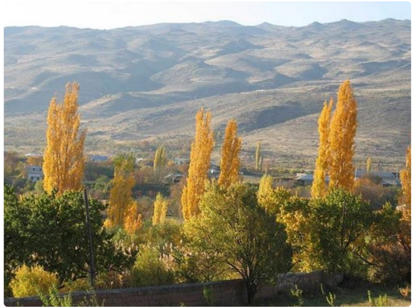
Nazervanin kylässä tuntuu aika pysähtyneen. Lehmät kulkevat kylätiellä, kukko herättää kiekaisullaan ja naapurit pitävät huolta toisistaan.

Kirjoittaja on freelancetoimittaja Kouvolasta