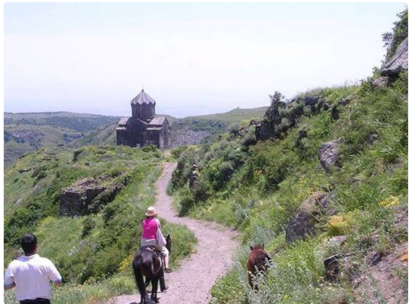
Amberdin linnoitus sijaitsee Armenian Alpeiksi kutsutussa vuoristossa, 2300 metrin korkeudessa. Pahlavounin suvun prinssit rakensivat sen jo 700-luvulla. Linnoituksen varustuksiin kuuluivat muun muassa vesijohto suoraan Aragats-vuorelta, maanalainen salainen käytävä rotkon alitse sekä kylpylä lattialämmityksineen.