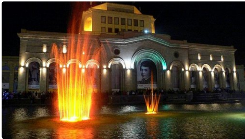
Kansalliskallerian edustalla pääsee ihaillemaan suihkulähdekonsertteja. Jerevan tarjoaa ylenpalttisesti kulttuurinautintoja.