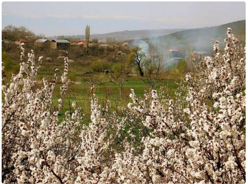
Kevät koittaa Nazervanissa.