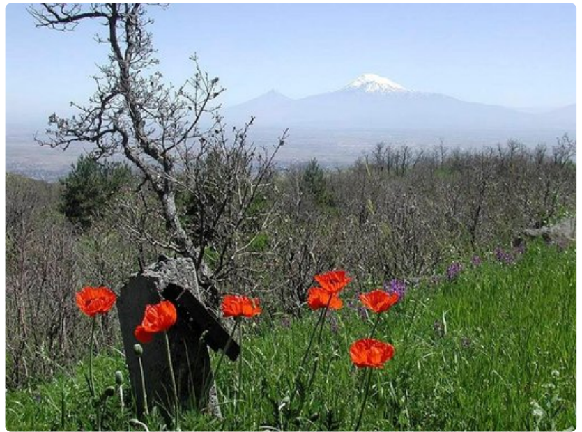
Ararat on armenialaisten pyhä vuori, jota he tänään voivat ihailta vain rajaa takaa. Turkin puolelle jäi myös Van-järvi, jolla sijaitsi Armenian tärkein saari, Aghtamar. Legendan mukaan järveen hukkui rakkaastaan erotettu nuorukainen, huutaen tyttänsä nimeä Aghtamar (Oi Tamar!)

Armenialaiset ovat onnistuneet säilyttämään niin käsittämättömän kielensä ja kirjaimensa kuin omaleimaisen kristinuskonsa. Armenian apostoliseen ortodoksikirkkoon kuuluu kuusi miljoonaa jäsentä ympäri maailmaa.