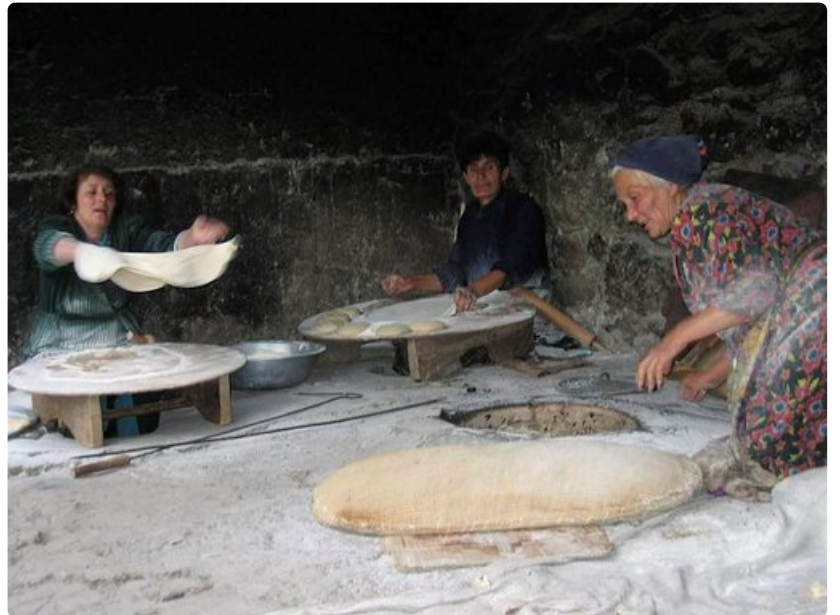
Lavash-leivän teko on turisteille aina pienoinen näytös, mutta Armeniassa jokapäiväistä elämää.