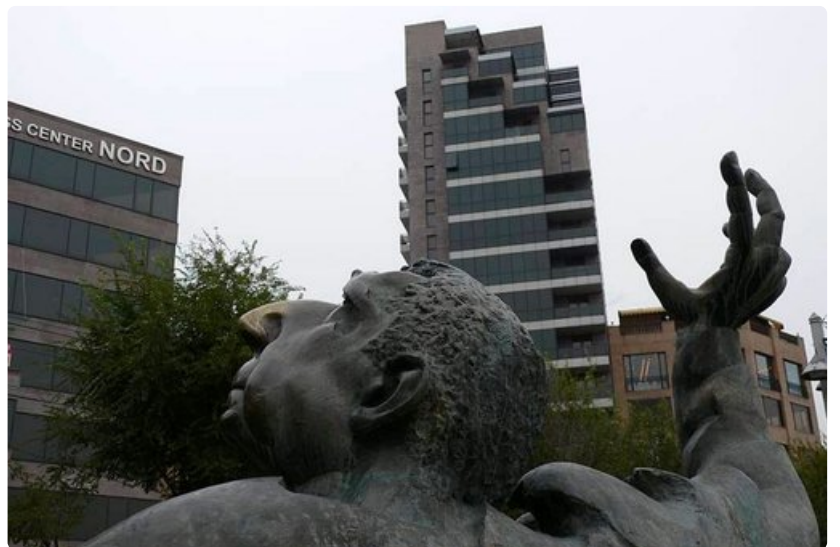
Säveltäjä Arno Babajanyan