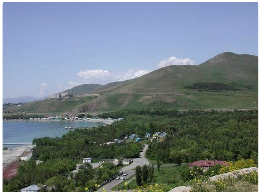
Sevan-järvi vaihtaa väriään päivän mittaan turkoosista sinisen eri sävyihin. Sevan on tunnettu paitsi prinssien kalaksi kutsutusta maukkaasta taimenestaan, myös lukuisista kirkoistaan. Kuuluisin lienee 874 eKr. rakennettu luostari.