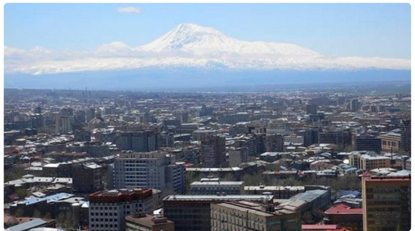
Jerevanissa asuu lähes puolet Armenian kansasta. Modernin vauhdikasta pääkaupunkia tarkkailee Ararat-vuori Turkin rajan takaa.