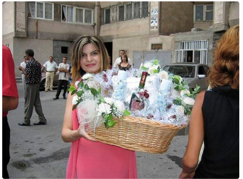
Armenialaiset ovat mestareita tekemään juhlan pienimmästäkin syystä. Häät ovat suurimpia syitä juhlaan, jossa sulhasen perhe lahjoittaa vihkiparille hääkorin herkkuihin.