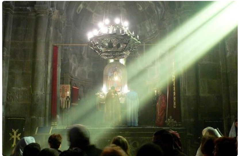
Geghardin luolaluostarissa pääsee kirkkopyhinä ja sunnuntaisin todistamaan perinteisiä armenialaisia rituaaleja. Niistä yksi on eläinuhri, matagh. Ikivanha tapa erottuu pakanallisista rituaaleista siten, että kiitosuhrin kurkkuun kaadetaan papin siunaamaa suolaa. Liha annetaan yleensä köyhille.