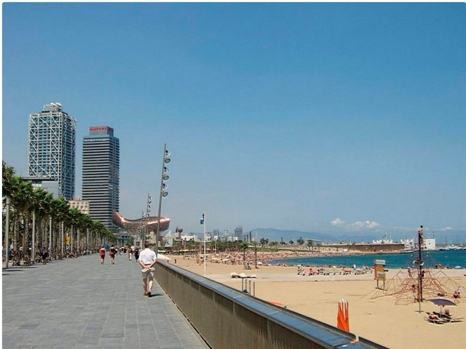
Barcelonassa yhdistyvät sopivasti kaupunki- ja rantaloma. Kaupunki on yksi suomalaiste suosikkikohteista.