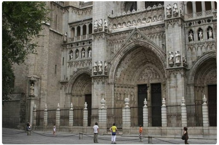
Toledon katedraalin pääsisäänkäynti. Kannattaa tarkistaa etukäteen, milloin matkailijoilla on pääsy kirkkoon.

Kaupungin nimeäminen vuonna 1986 UNESCO:n maailmanperintökohteeksi ei ainoastaan suojele tuolloin vallinnutta miljööttä, vaan säätelee tarkkaan uusien rakennushankkeiden toteuttamista. Niinpä ainoa uudisrakennusten julkisivuissa sallittu materiaali on perinteinen kellanruskea savitiili. Sisätiloissa sen sijaan kukin saa toteuttaa omia mieltymyksiään.