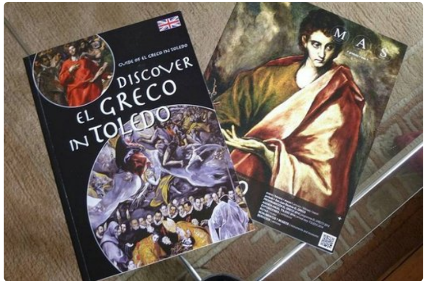
Toleodon saapuvan kannattaa välittömästi hankkia Toledon matkaopas ja El Greco -kirjanen. Niistä löytyy kaikki olennainen.