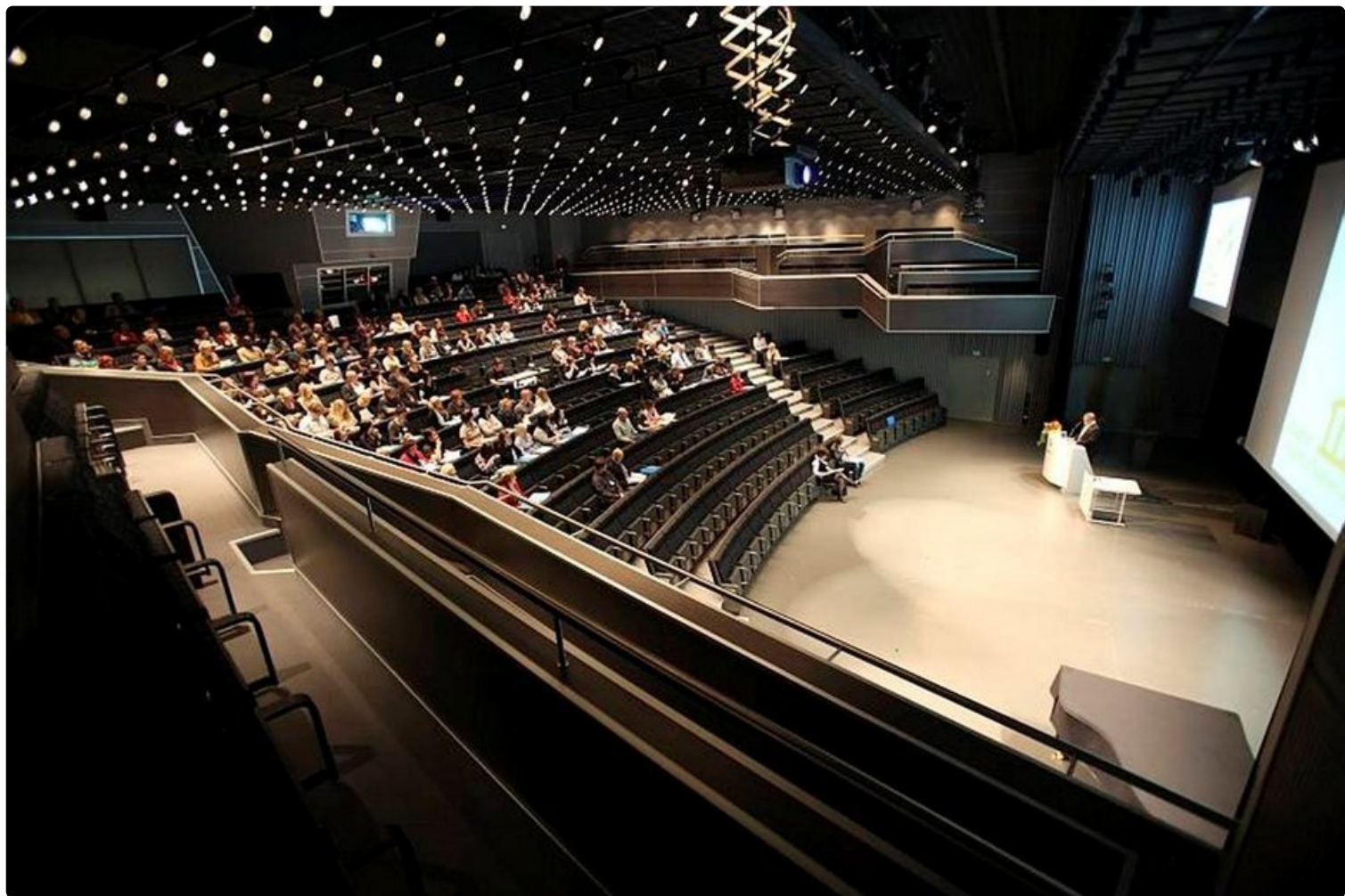
Suomi saa kokousmatkailusta arvostusta Saksasta. Tässä kuvassa auditorio Olostunturin uumenissa.