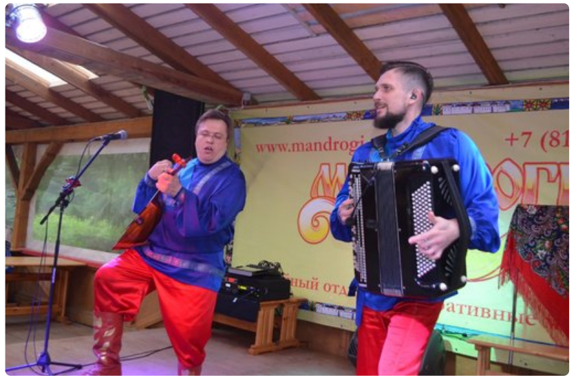
Moskovan Aika esiintyy vauhdikkaasti Mandrogin turistisaarella.