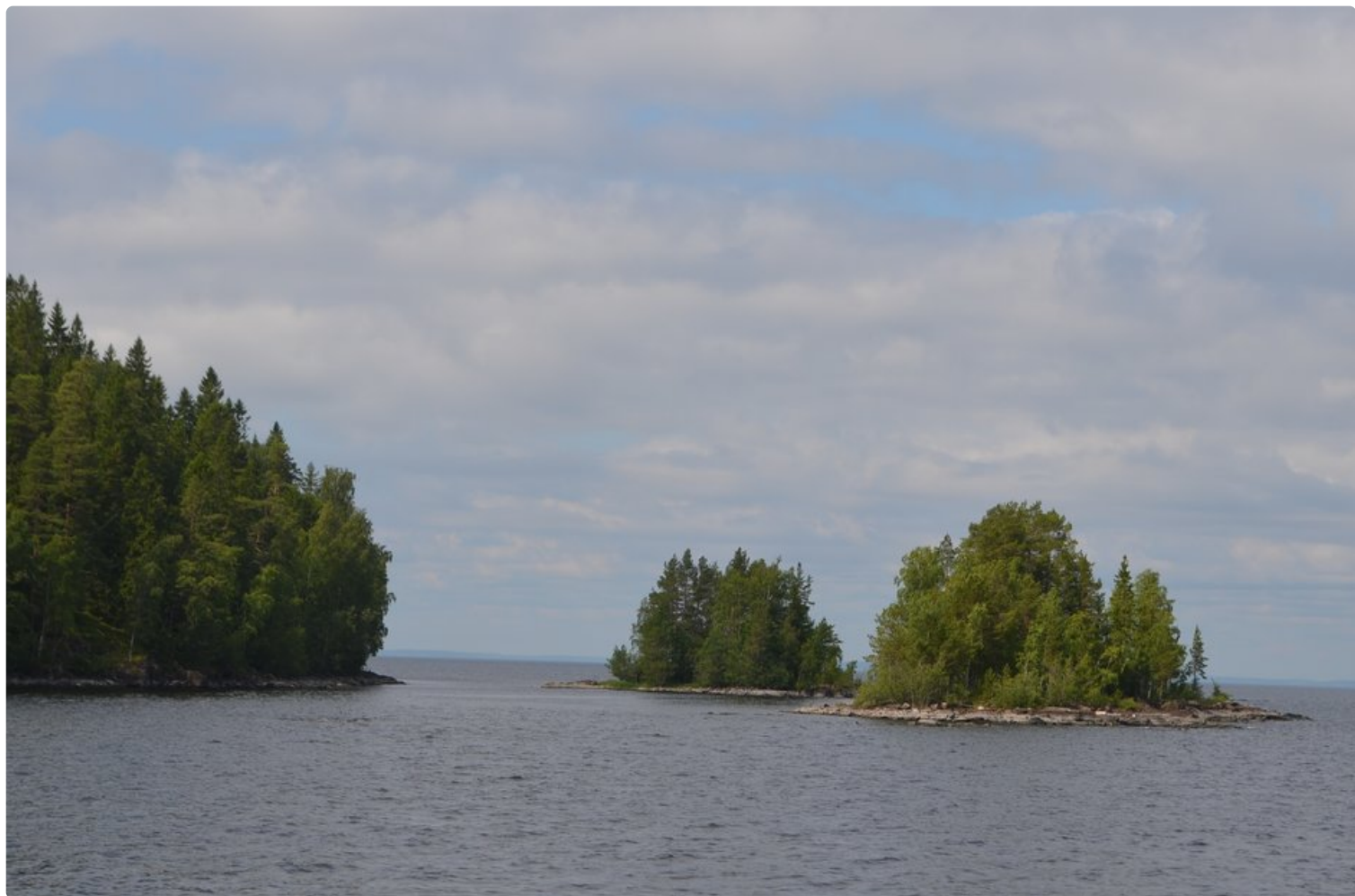
Laatokassa on 500 saarta, useat entisellä Suomen alueella.