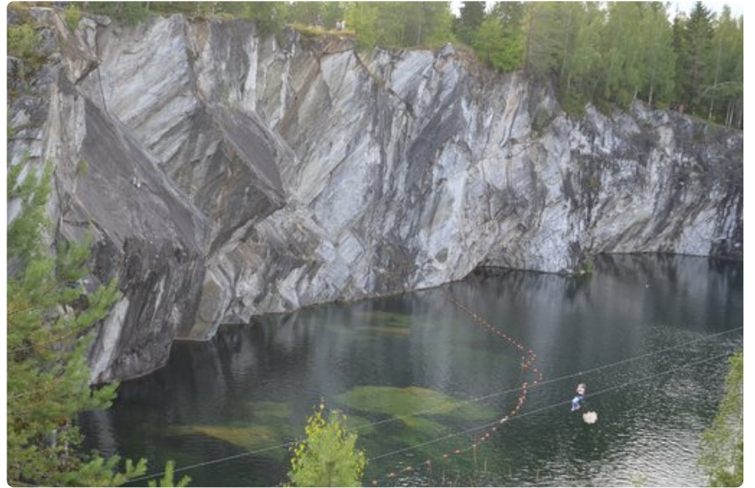
Ruskealan marmorilouhos Sortavalassa on suosittu turistikohte.