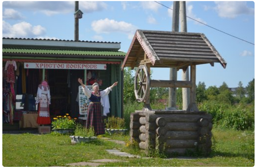
Aleksanteri Syväriläisen luostari on suosittu matkailukohde.