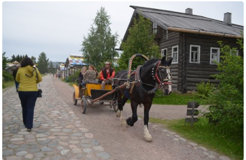
Mandrogin turistikeskuksessa voi liikkua vaikka hevosella.