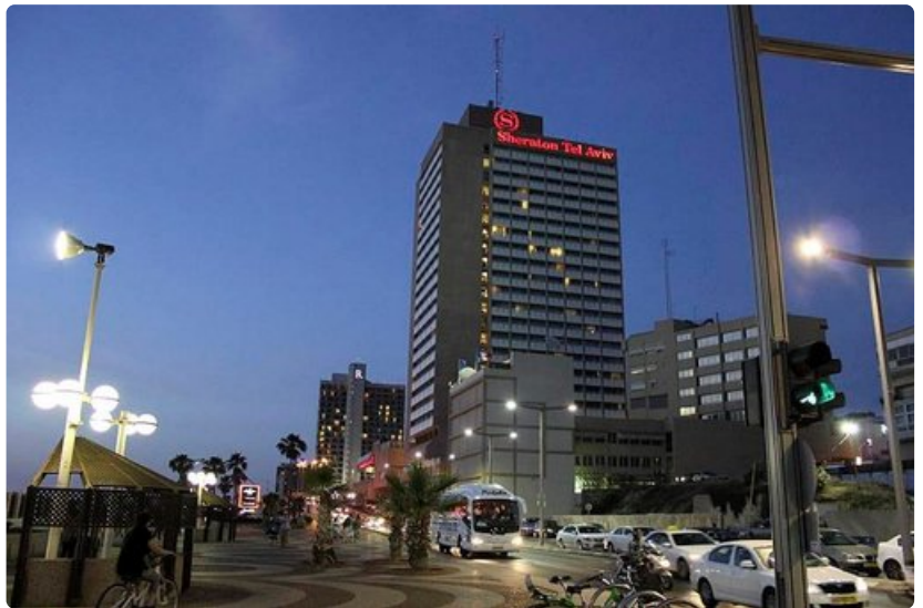
Tel Aviv ei nuku koskaan.