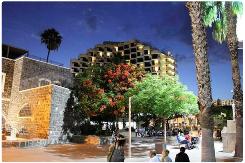
Tiberiaksen rantabulevardilla on menoa iltaisin.

Valuutta: Israelin uusi sekeli (ILS), 1 €=4,71 ILS