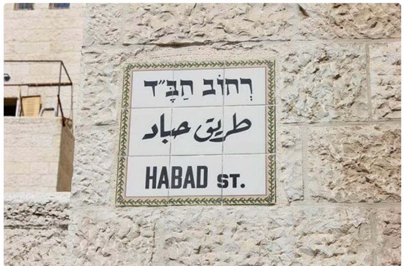
Kadunnimet kerrotaan kolmella kielellä.