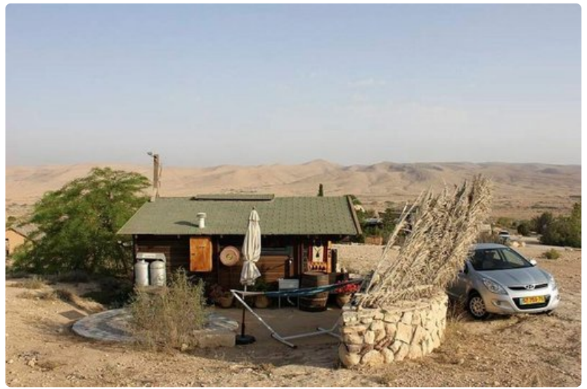
Autolla pääsee kätevästi myös mökkimajoitukseen automaahan.

Länsi-Jerusalemin värikäs päivittäistavaratori Mahane Yehuda muuttuu illalla pienten ravintoloiden ja baarien keskittymäksi. Lähes huomaamaton ravintola Fortuna tarjoilee erinomaista Jerusalemin mixed grilliä - nautan kaikkia osia iloisessa sekamelskassa. Iltaa voi jatkaa Cafe de Paris -baarissa, joka on erikoitunut pienpanimoiden oluihin. Pienpanimot elävät samanlaista nousukautta kuin viinilatkin. Uutta Jerusalemissa on 2012 vuoden alussa käyttöön otettu raitiovaunu. Se yhdistää Länsi- ja Itä-Jerusalemin ja on rauhoittanut aiemmin niin ruuhkaisen Jaffankadun, jolla ei saa enää ajaa autolla. Koska kyse on Jerusalemissa, myös raitiovaunu on osoittautunut