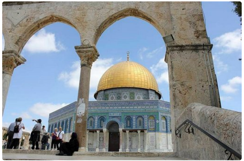
Kalliomoskeija on paikalla, josta Muhammedin uskotaan nousseen taivaaseen.

Korttiautomaatti hyväksyy suomalaisen korttini, mutta laite haluaa pin-koodin sijasta henkilötunnuksen. Suomalainen henkilötunnus ei