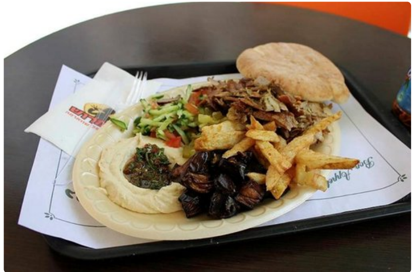
Hummusta ja shawarmaa edullisesti.