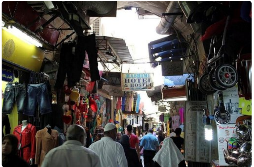
Jerusalemin Vanhankaupungin basaareissa on aina vilskettä.