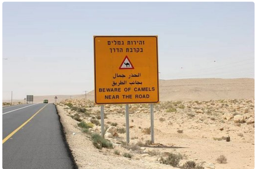
Varoitukset ovat selkeitä.