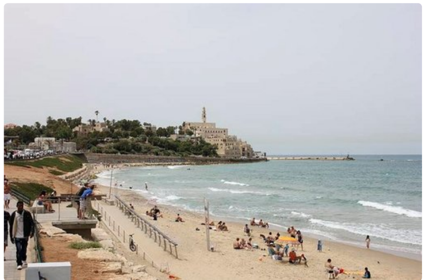
Vanha Jaffa on aivan Tel Avivin rantojen kupeessa.