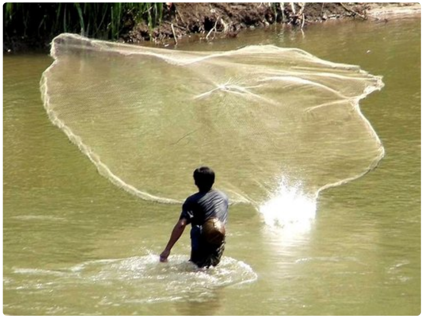
Mekong-joki tarjoaa monelle mahdollisuuden lisätä hieman aterioiden proteiiniipitoisuutta eväkkäillä.

Myös pienen etelälaosilaisen kylän ja sen uskomattomat ihmiset.