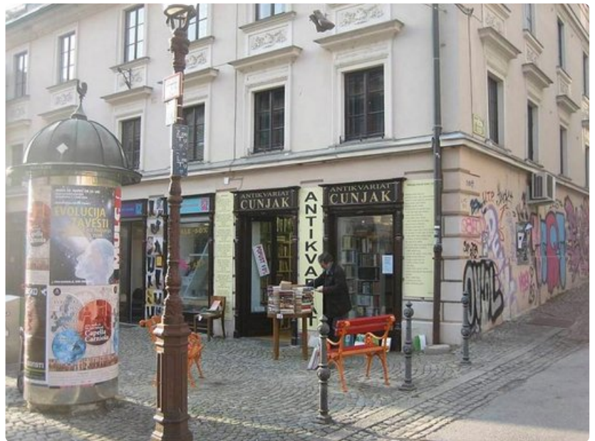
Vanhankaupungin kauppiaat virittelevät pihakauppaa jo maaliskuun alussa.