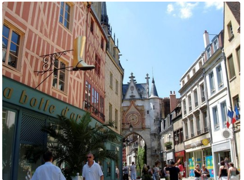
Auxerre'n Vanhakaupunki sykkii kahvila-, ravintola- ja shoppailuelämää.