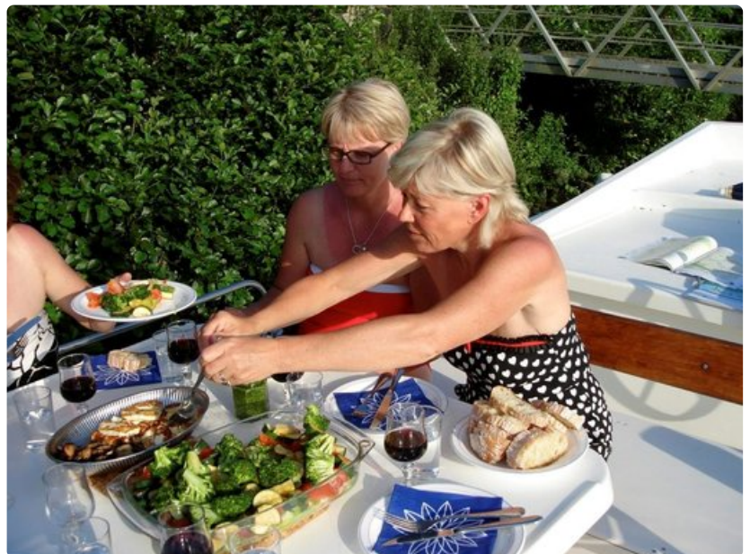
Torikassin herkut lounaaksi laitettuina.