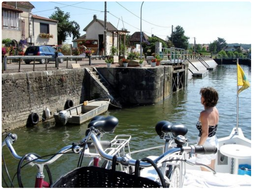
Ei päivää ilman pyöräretkeä.