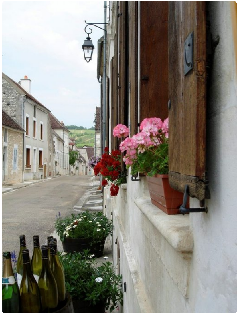
Irancy'n pikkukylässä on lukuisia viinitarhojen omia myymälöitä.