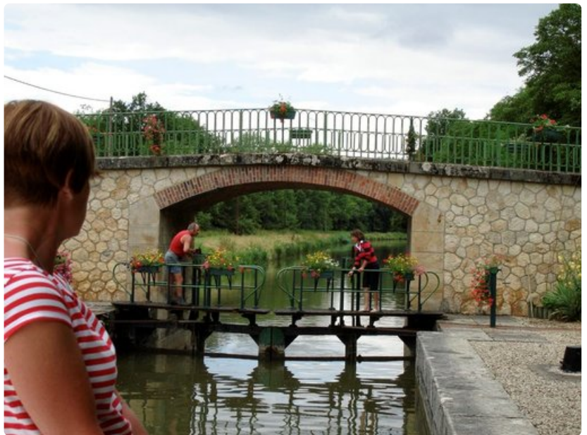
Pienillä käsikäyttöisillä suluilla voi vaihtaa paikallisia kuulumisia.