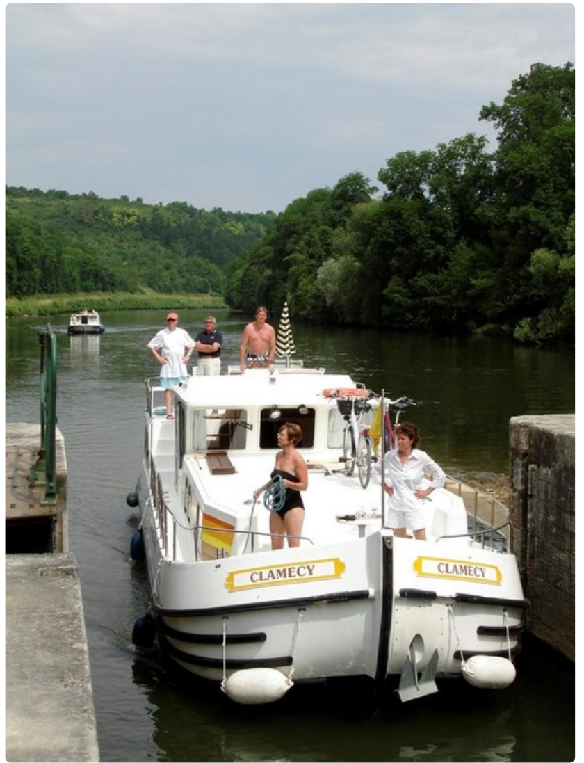
Kesäloimakoti Clamecy tekee matkaa mitä upeimmissa maisemissa.