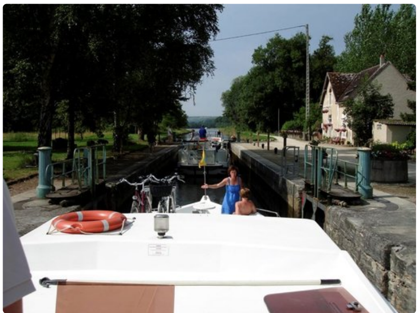
Viehättävän Auxerre'n kaupungin vauraus pohjaa sen ympärillä oleviin Chablis-viiniviljelmiin.