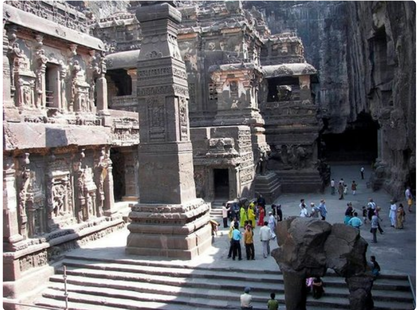
Elloran loppumattomat luolat on kaiverrettu tuliperäiseen kallioon.

Kolmannen päivän ohjelmaan kuuluu venematka Sindhuburgin linnoituksen temppeliin. Lisäksi vierailimme käsityökylässä. Taj Mahal -kokkien valmistaman lounaan nautimme rantalomakylässä, jonka jälkeen matkaamme bussilla Laxmi Narayanan vanhaan temppeliin.