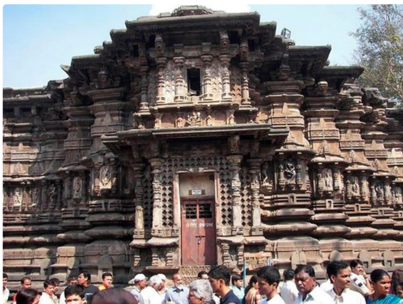
Tempplien hienostuneet seinäkuviot ja ihmismäärät hämmästyttivät.