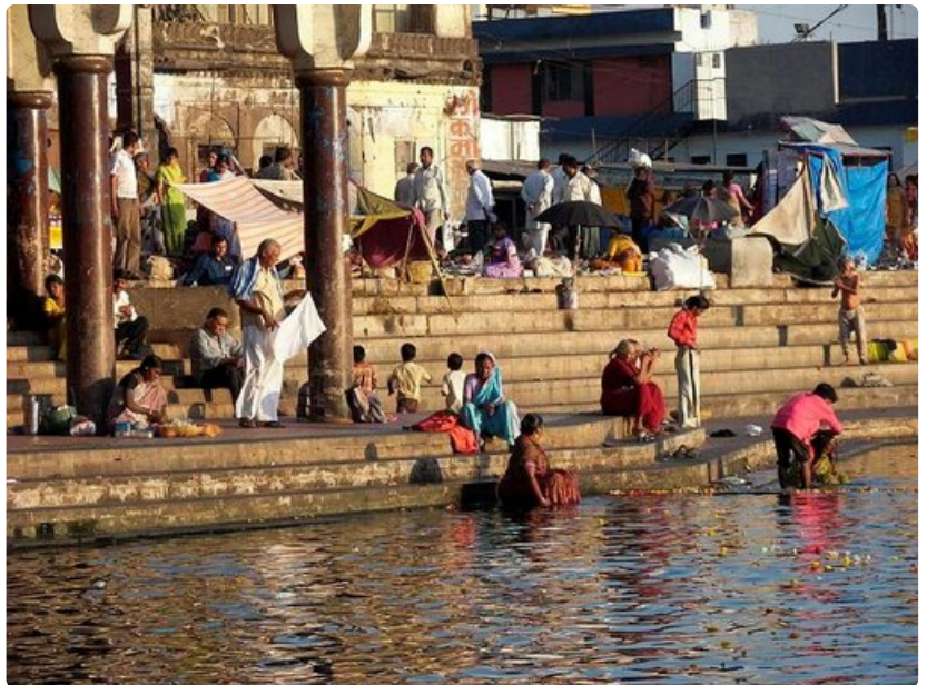
Pyhä Godavari-joki Nasikissa on täynnä elämää.