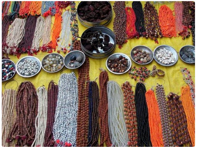
Intialaiset rakastavat voimakkaita värejä, makuja ja tuoksuja.