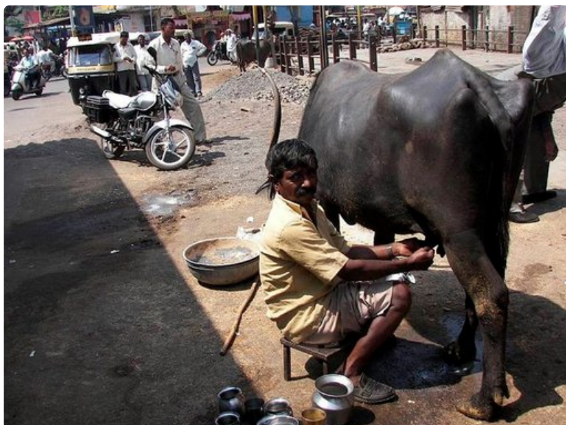
Vasta lypettyä buffalon maitoa myytiin torilla.