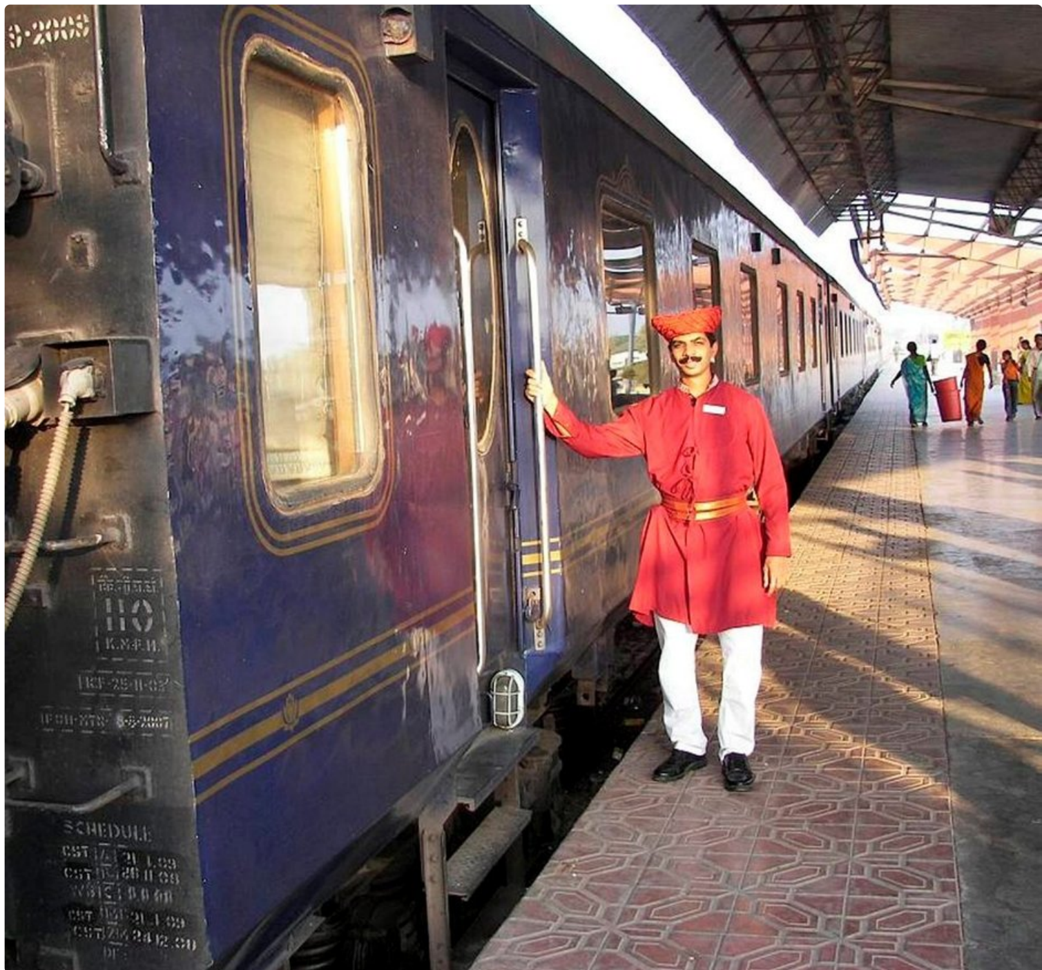
Vaunun aulassa, alaslaskettavalla puulaverilla yöt nukkuva hyttipalvelija oli aina hyväntuulinen ja käytettävissä, vaikka aamukolmelta.