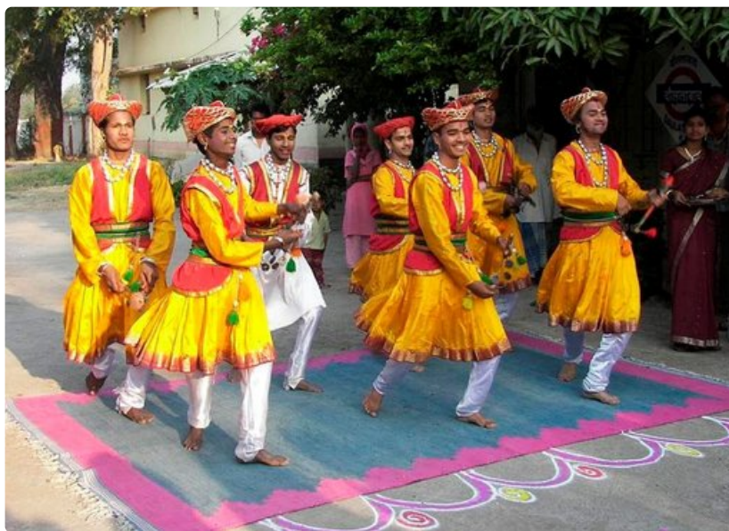
Matkan hintaan sisältyi intialaisia tanssi- ja musiikkiesityksiä.