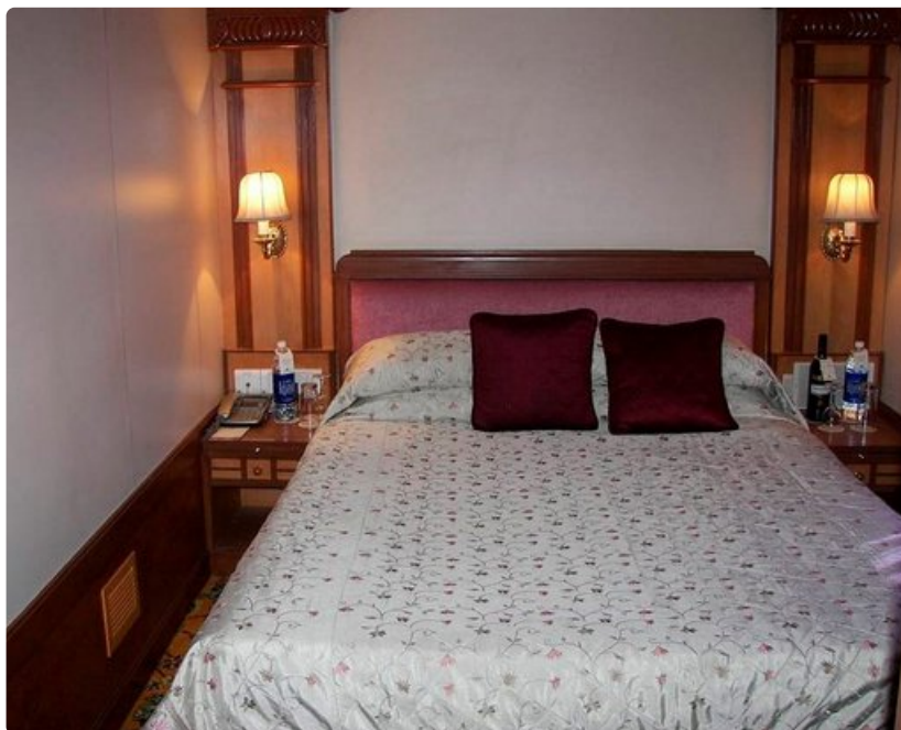
Junan hytit olivat hyväkokoisia.

http://www.theluxurytrains.com/india/deccan-odyssey/