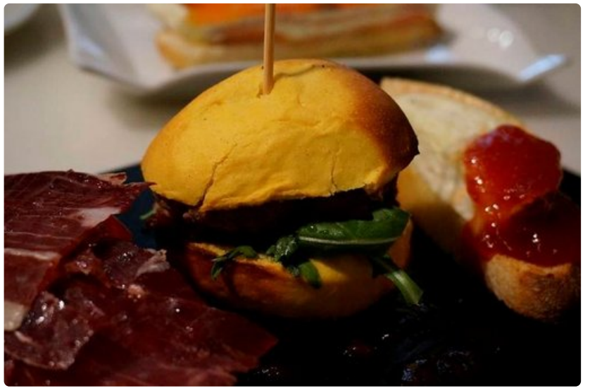
La Barran tapas-valikoima koostuu yksinkertaisista klassikoista. Mehevä minihampurilainen edustaa uusia tuulahduksia.