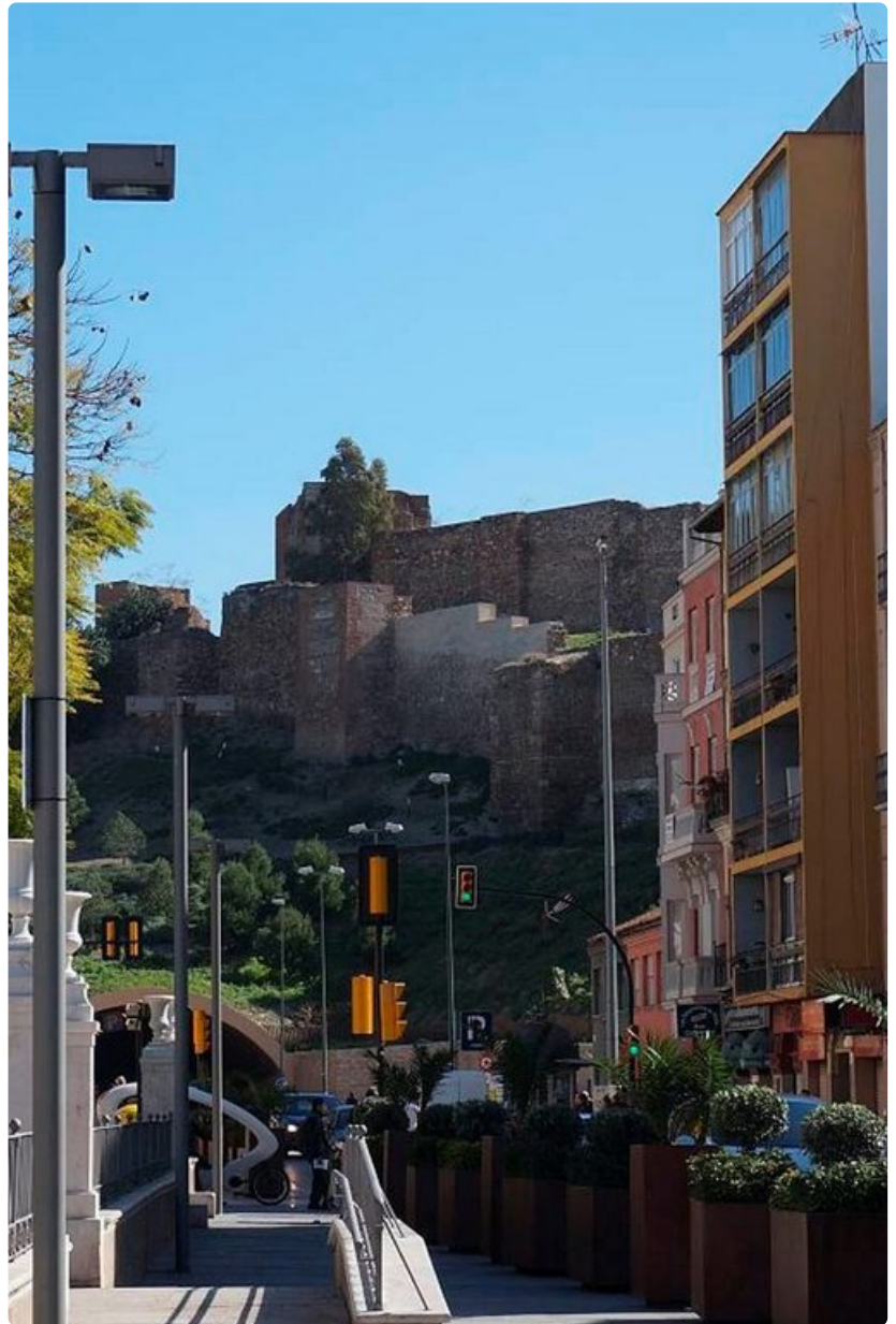
Muslimivallan aikana rakennettu Alcazaban linnoitus vartioi Malagan kaupunkia ja satamaa.