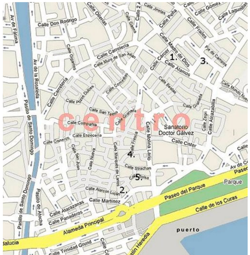
Tapas-ravintolat on merkattu Malagan karttaan numeroilla 1-5.