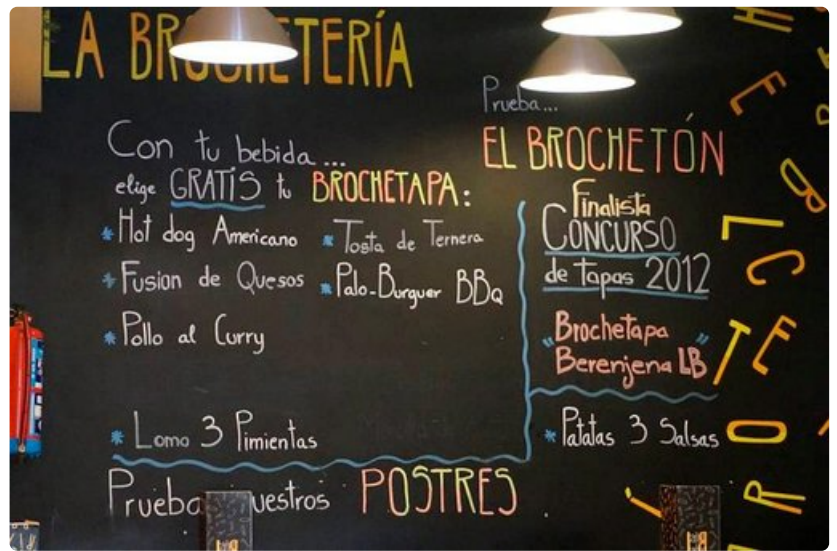
La Brocheterian nuorekas ja urbaani imago näkyy myös ravintolan sisustuksessa.