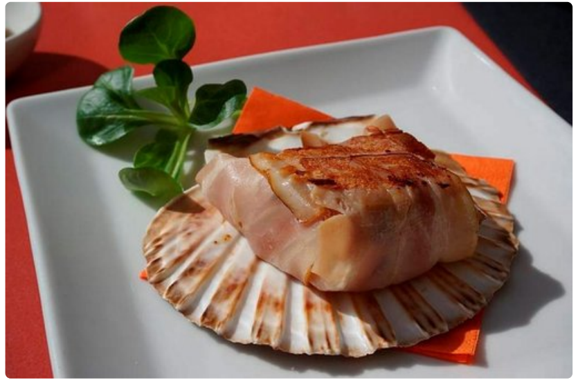
La Fabrican pekoniin käärityssä kampsimpukassa kohtaavat välimerellinen raikkaus ja andalusialainen yksinkertaisuus.