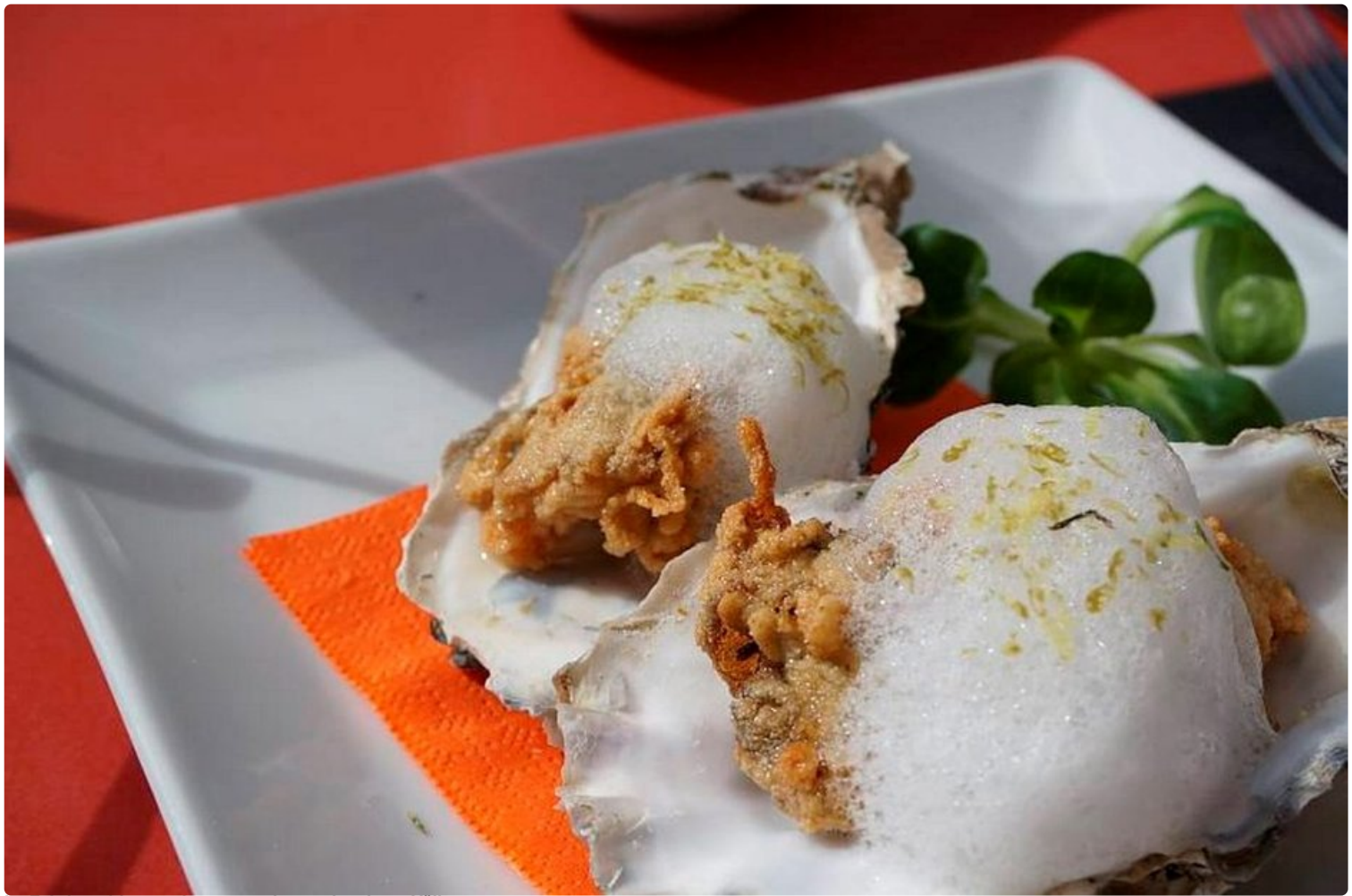
La Fabrican friteeratuissa ostereissa voi maistaa Välimeren.