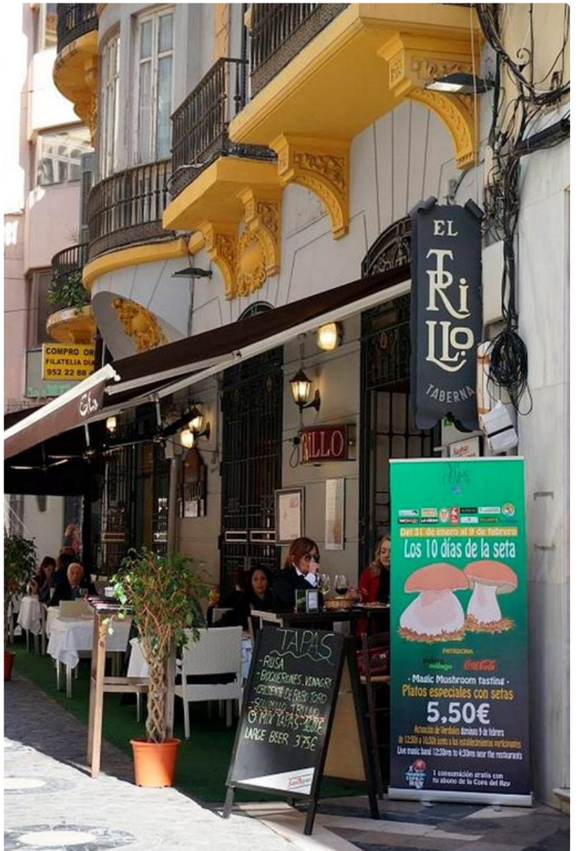
El Trillo sijaitsee ahtaalla sivukujalla suosittu ostoskadun varressa.