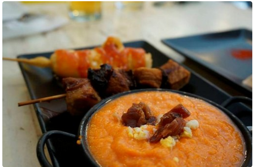
Kylmänä tarjoiltua tomaattisosekeittoa, lihavarras ja friteerattu juustovarras.