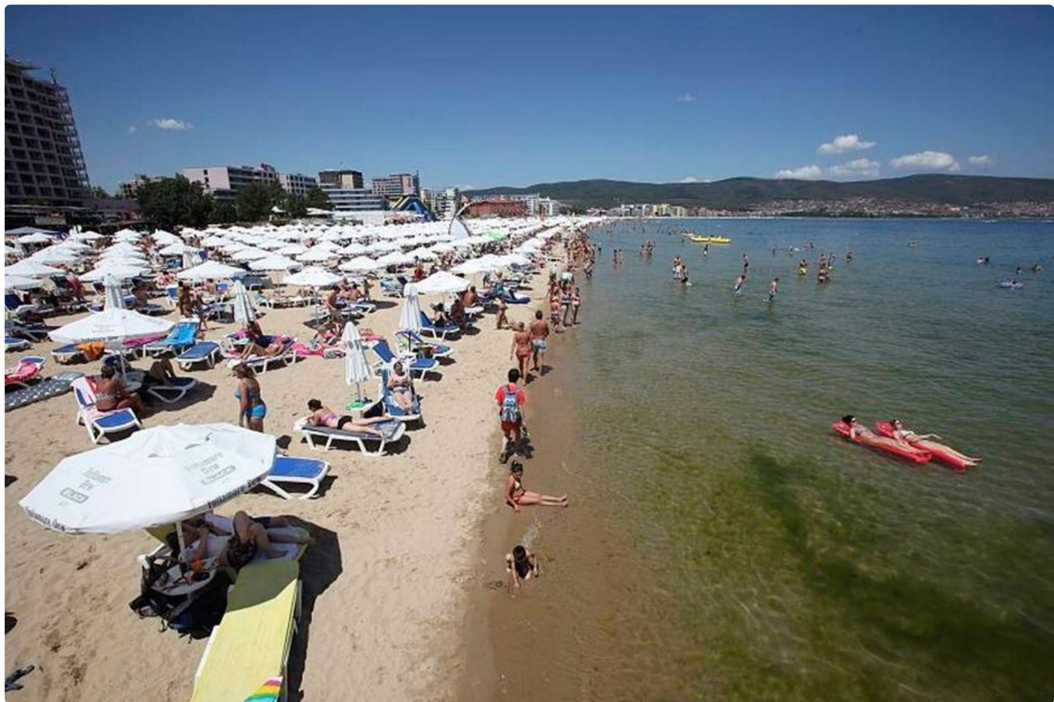
Bulgarian kuuma kesä houkuttelee turistik viilentymään Mustanmeren rannalle.