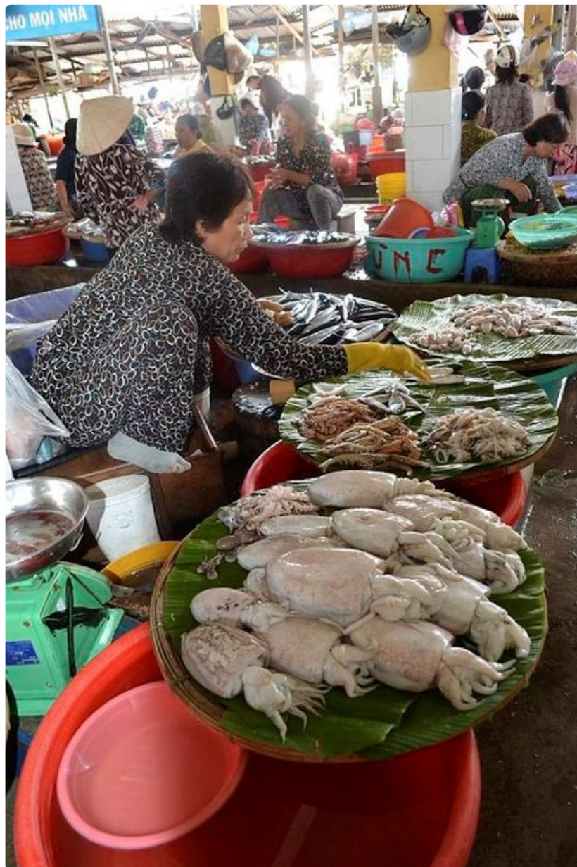
Tra Nang Xo Moi -torin antia.