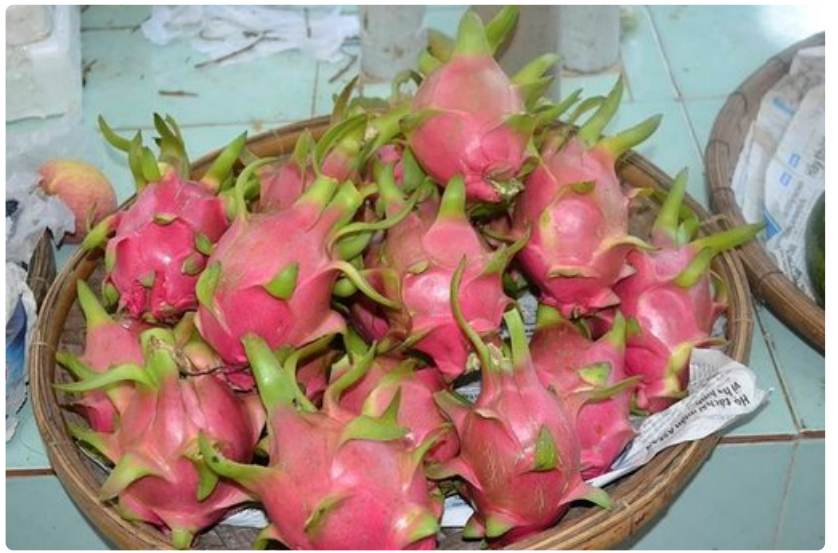
Pithaya-hedelmiä on tarjolla Suomessakin.