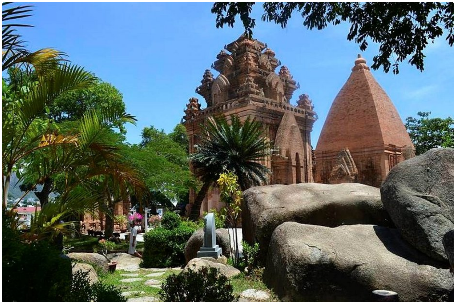
Vasemman puoleinen rakennelma on Ponagarin kunniaksi rakennettu torni 800 vuotta ennen ajanlaskun alkua. Oikealla pieni tempelli.