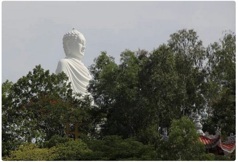
Buddha-patsasta voi etsiä horisontista pitkänkin matkan päästä.

Torin ilmapiiri on miellyttävä, kuten kaikkialla Vietnamissa. Myyjät eivät tyrkytä tavaroitaan ja asiakasta kohdellaan ystävällisesti. Torilla oli myynnissä muun muassa pithaya-hedelmiä, joita tarjotaan usein vietnamlaisissa ravintoloissa. Myös Suomessa on myytävänä näitä kalamaria muistuttavia valkoihaisia hedelmiä.