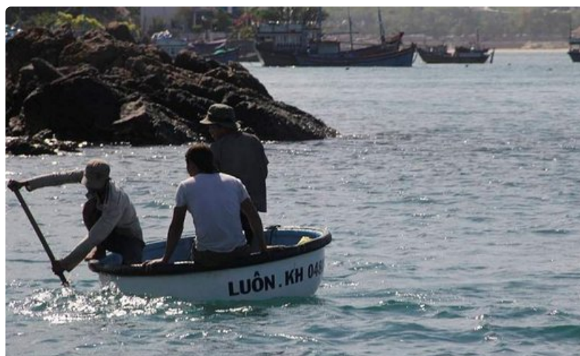
Kuppiveneen kuljetuskapasiteetti määräytynee kehän pituuden mukaan.