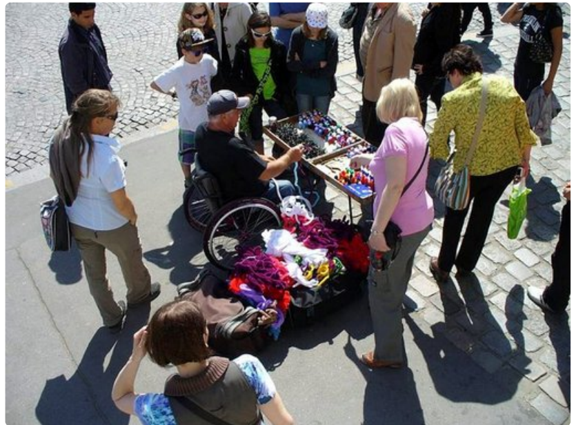
Pyörätuolissa istuva mies myy matkailijoille tekemiään avaimenperiä Montmartella.