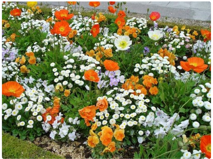
Luxemburgin puiston väriloistoa.