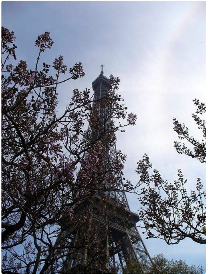
Eiffel-tornin kakkoskerroksen pääsee myös pyörätuolilla liikkuva.

Hyvä vaihtoehto on myös Musée d'Orsay, 1800-luvun taiteen museo, josta saa lainaksi pyörätuolin. Kaikkiin kolmeen kerrokseen pääsee hissillä ja luiskoja on riittävästi. Suuri keskikäytävä on täynnä veistostaidetta, joka avautuu upeana avaran lasikaton ansiosta.