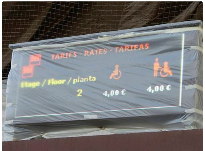
Liikuntarajoitteinen henkilö maksaa Eiffel-tornin lipusta alennetun hinnan ja avustaja kulkee mukana ilmaiseksi.