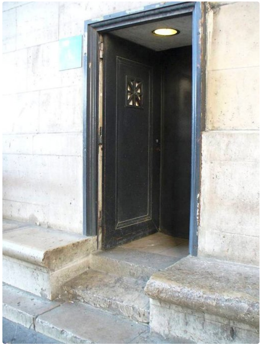
Kyltin mukaan Riemukaaren katolle pääsee hissillä myös pyörätuolin kanssa, vai pääseekö?

Pitkin suuria bulevardeja ajellessa ja lukuisia siltoja ylittäessä hämmästelee kaupungin muuntautumista. Oopperan ympäristön tyylikäs ilmapiiri vaihtuu äkkiä boheemiksi ja sitten trendikkääksi, Gare du Nordin ympärillä jopa levottomaksi bussin vieriesä Bulevard St Magentaa.