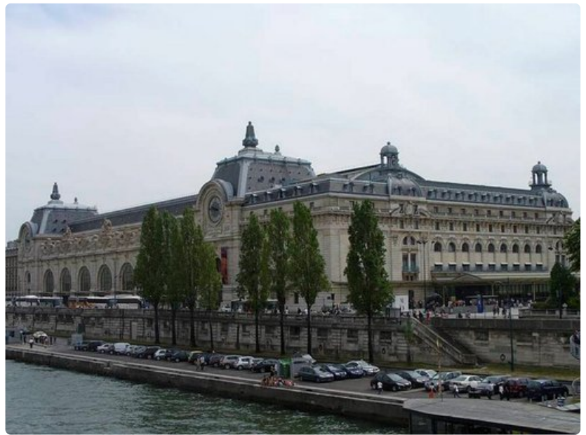
Mielenkiintoinen Musée d'Orsay on myös esteetön.