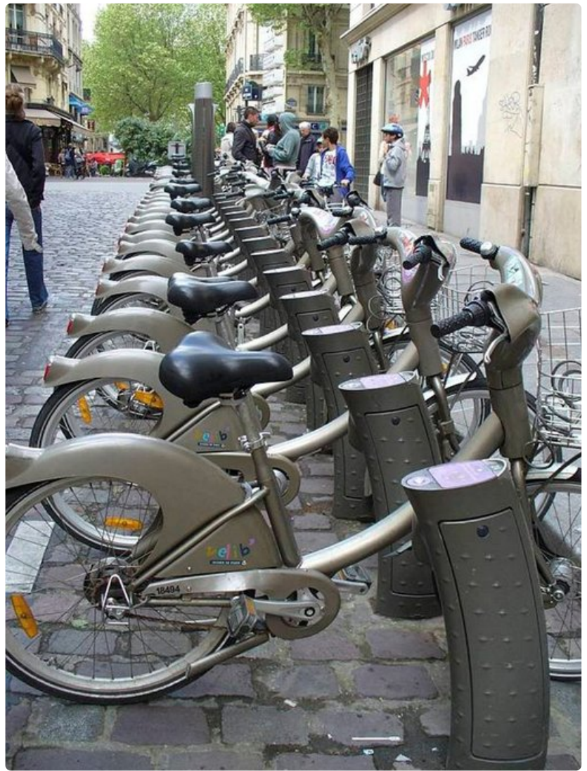
Kaupunkipyörällä pääsee edullisesti paikasta toiseen.