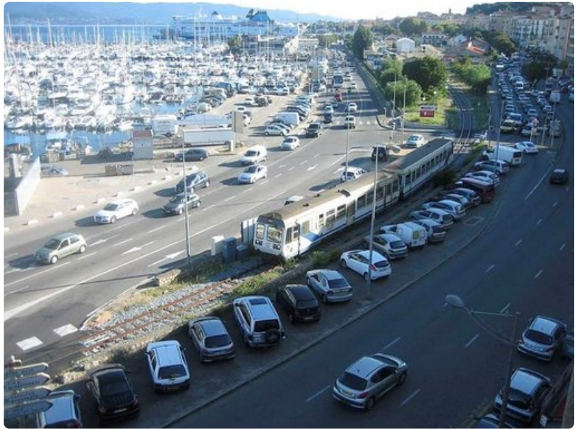
Napoleonin mukaan nimetty ruuhkainen pääväylä johtaa Ajaccion keskustaan.