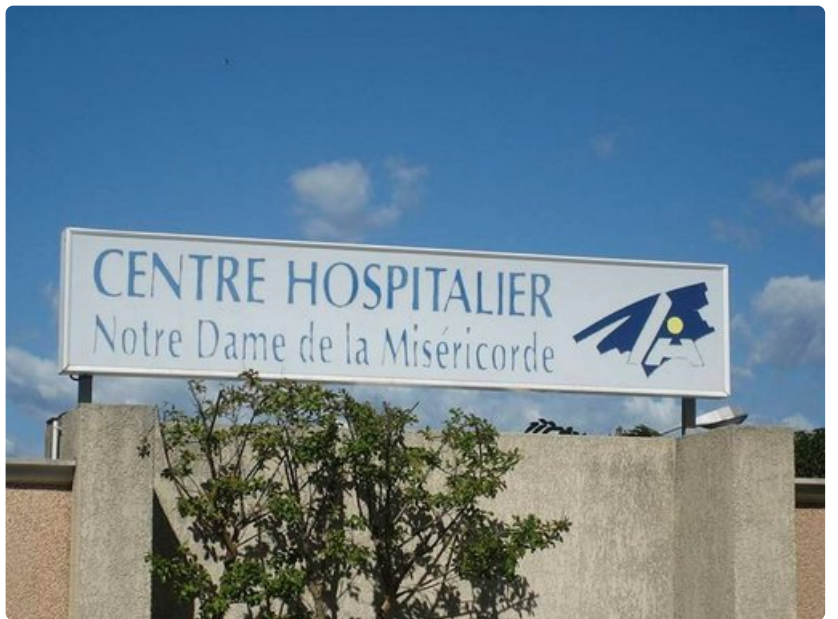
Napoleon kruunattiin keisariksi Notre Damen katedraalissa. Notre Damen mukaan on nimetty myös kaupungin keskussairaala.