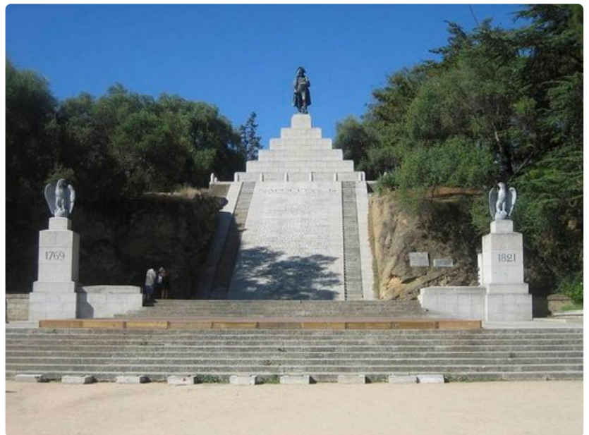
Napoleonin muistomerkki sijaitsee korkealla kukkulalla.