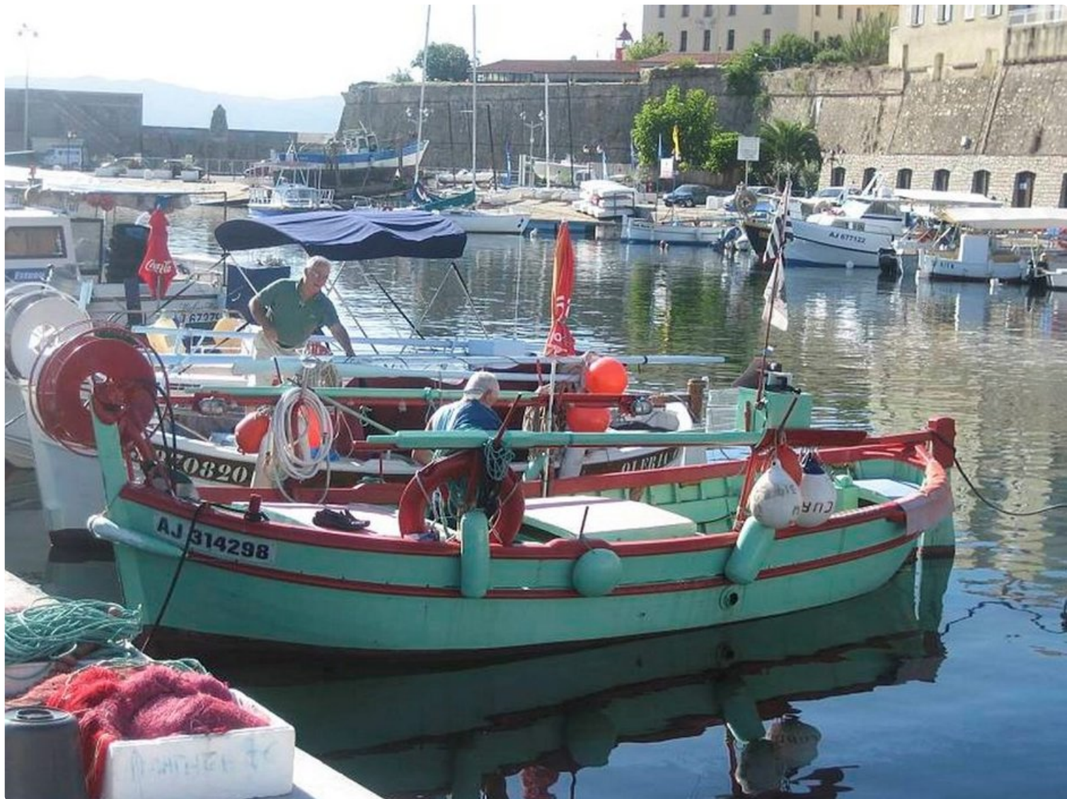
Värikkäät kalastusveneet henkivät Korsikan leppoisaa tunnelmaa.