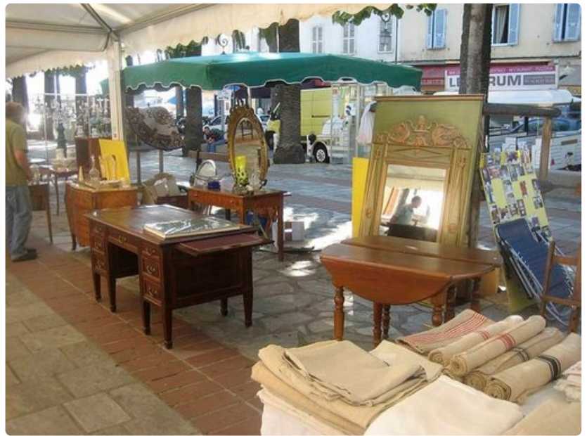
Napoleonin synnyinkaupungissa Ajaccioissa kirpputori löytyy keskeltä katua.

Karkotus Saint Helenalle: Hänet vangittiin hävityn Waterloon taistelun (18.6.1815) jälkeen ja karkotettiin Saint Helenan saarelle, 2 800 kilometrin päähän Guineanlahden rannikosta 15.9.1815. Siellä häntä vartioi 2 000 miestä ja kaksi sotalaivaa, jotka kiersivät saarta ympäri vuorokaudeni. Saarella hän oli vanki ja kirjoitti muistelmansa ja testamenttinsa vangitsijoitaan kritisoiden.