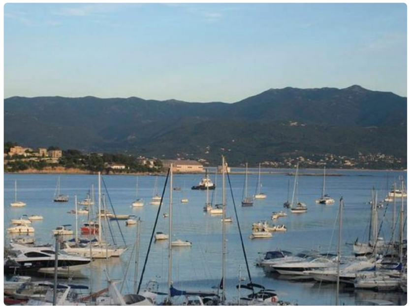
Ajaccion sydän on Välimeren tapaan kaupungin satama.