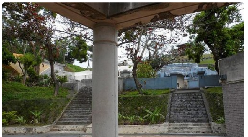
Japanin laivaston tulenjohtokeskus.