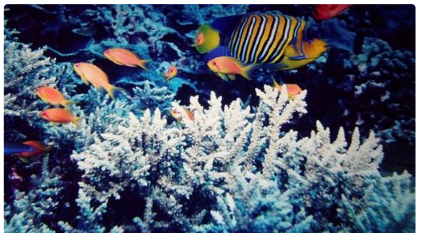
Churaumin akvaariossa voi ihailia koralleja ja kaloja.