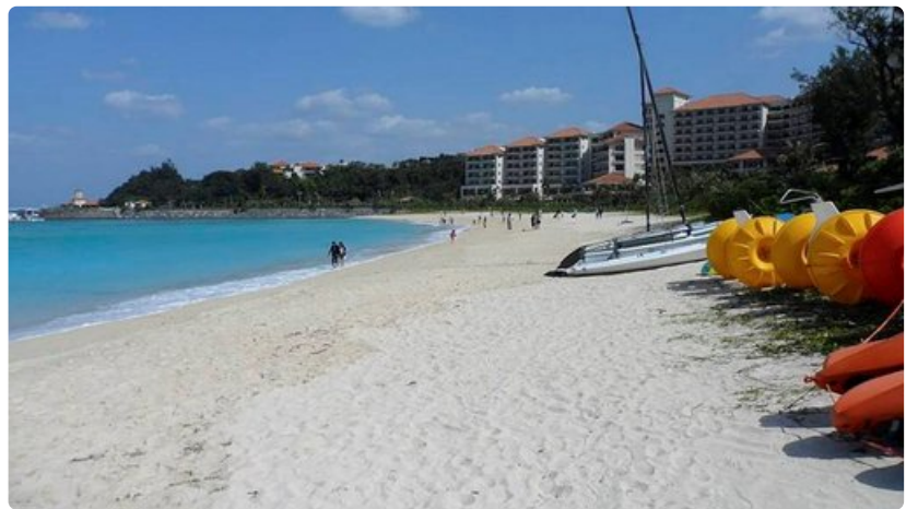
Okinawa Busena Beach resort.