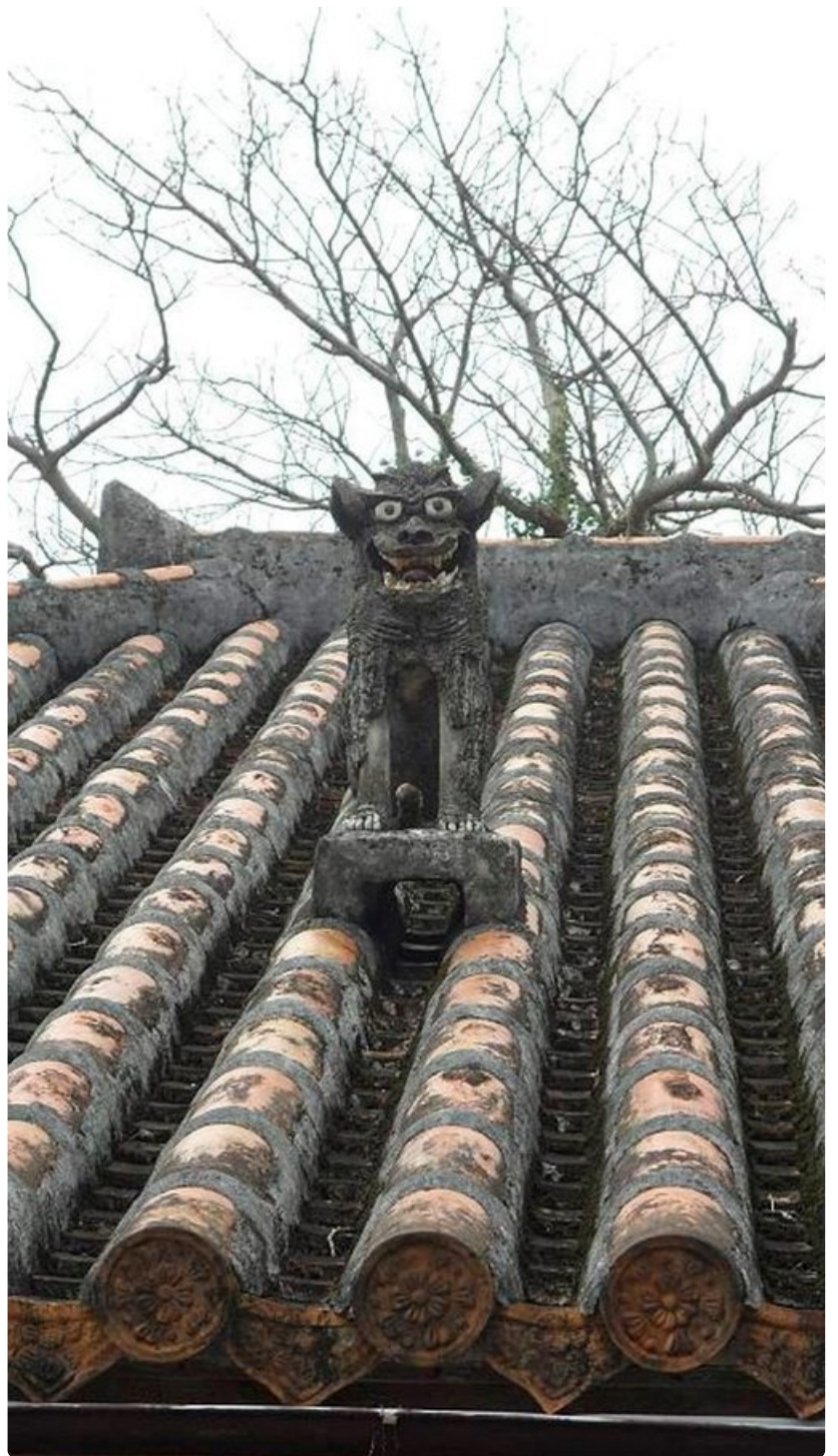
Perinteisen talon katto ja suojelija.