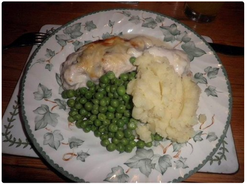
Skotlantilainen herkku haggis.