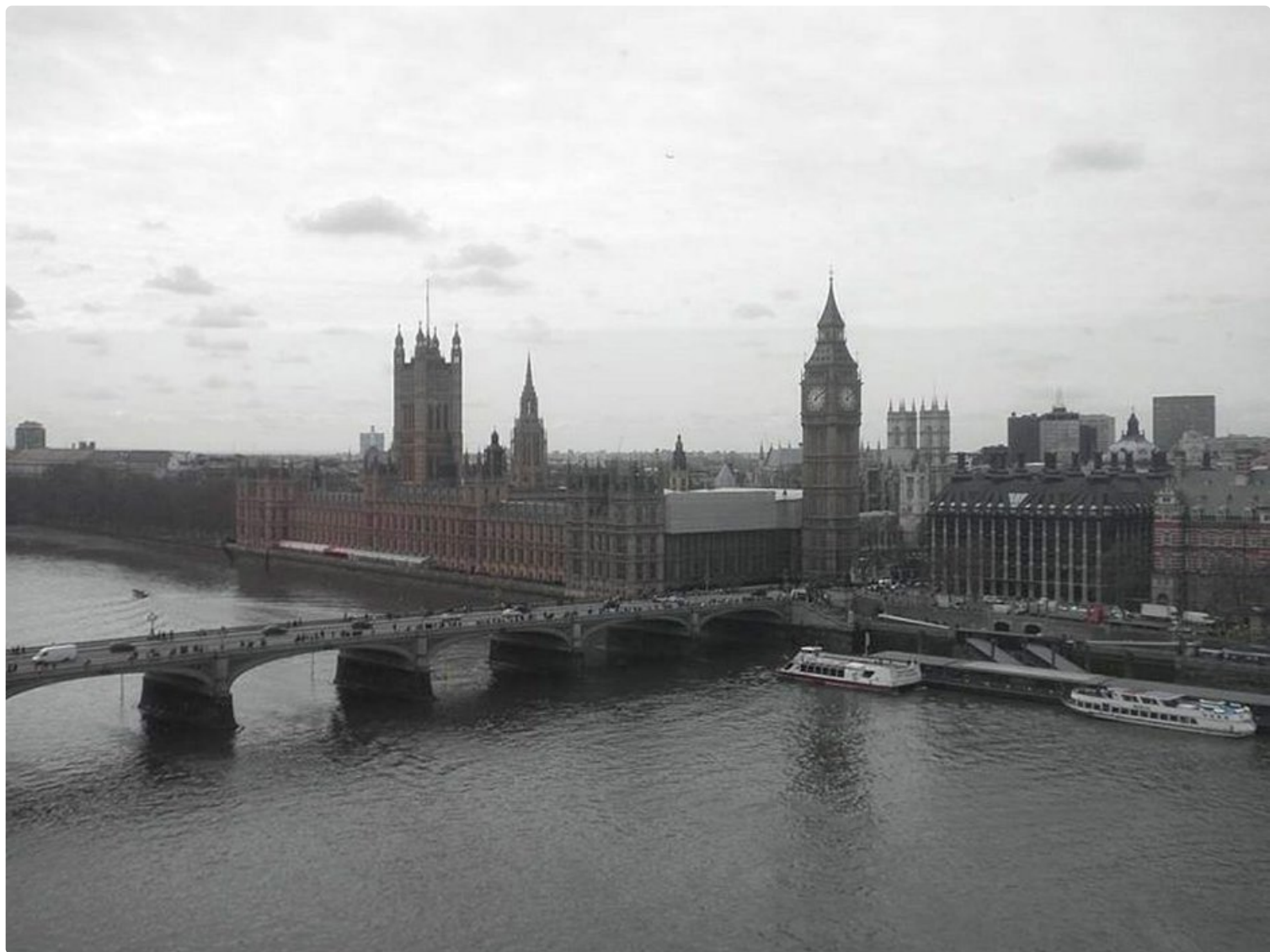
Westminster Abbey ja Big Ben.