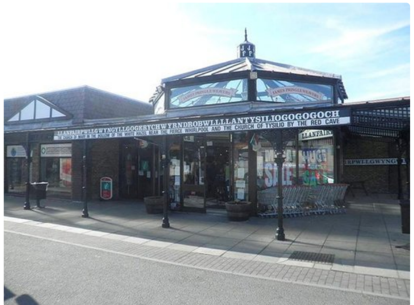
Maailman pisin aseman nimi Walesissä.