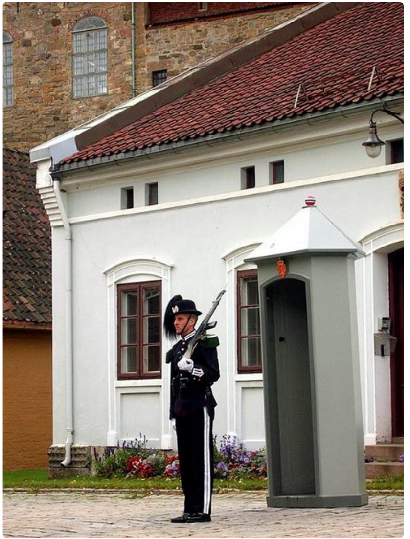
Akershusin linnan on Oslon tärkein matkailukohde.