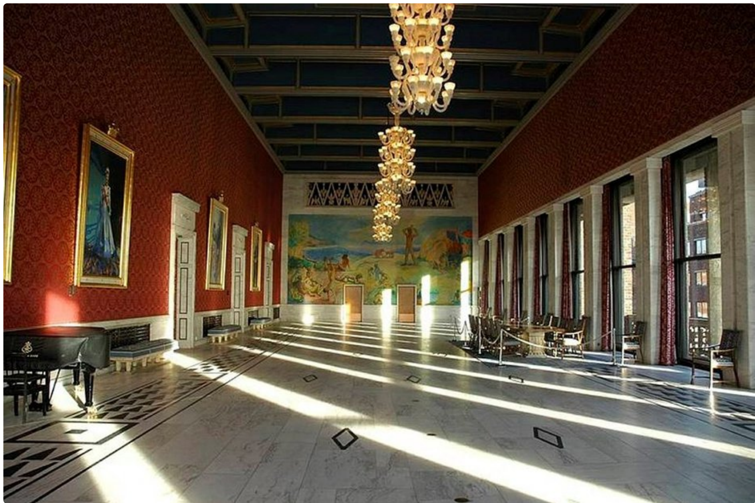
Oslo'n palikkamaisen kaupungintalon sisätilat ovat koristeelliset.