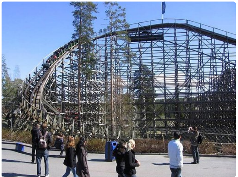
TusenFryd-huvipuiston vuoristoradan jälkeen pulssin voi tasata jossakin puiston monista ravintoloista.