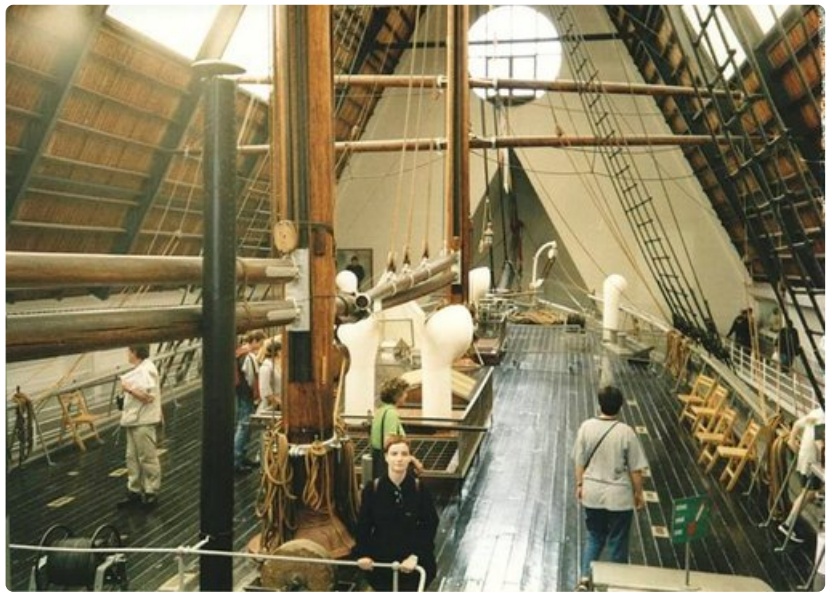
Fram-museo tarjoaa aikamatkan menneeseen.