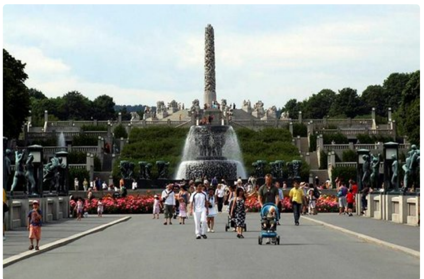
Vigelandsparkenissa on yli 200 veistosta.