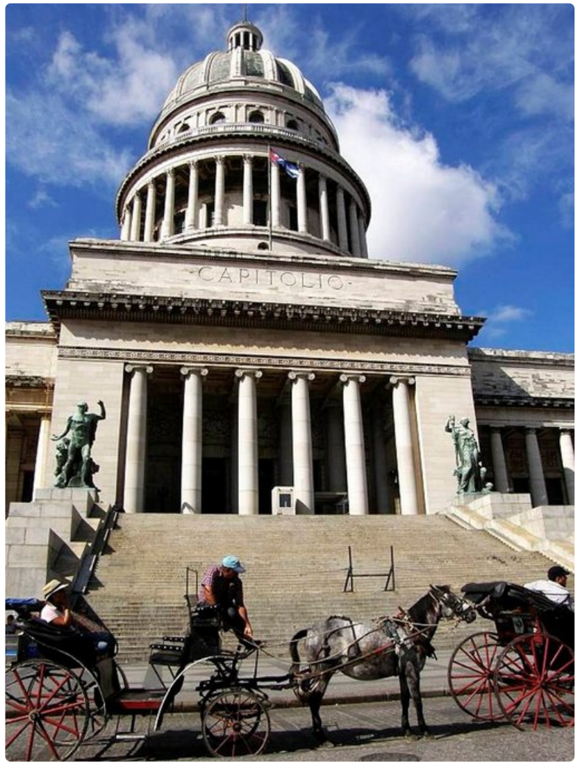
Capitolion edustalta voi lähteä tutustumaan Havannan nähtävyyksiin hevoscarrin kyydissä.

o Syksyllä on tarjolla seikkailupurjehduksia Euroopan vesillä, ja marraskuussa alukset suuntaavat jälleen kohti Karibiaa. Atlantin ylitykselle lähdetään Kanariansaarilta.