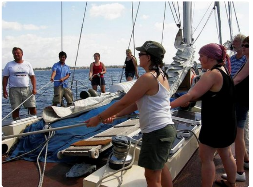
Purjeiden nostoon tarvitaan koko oppilasjoukko.