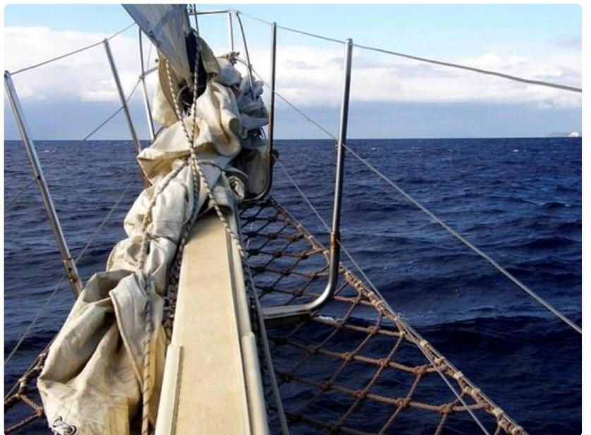
Aavan meren katseleminen rauhoittaa mielen ja kirkastaa ajatukset.