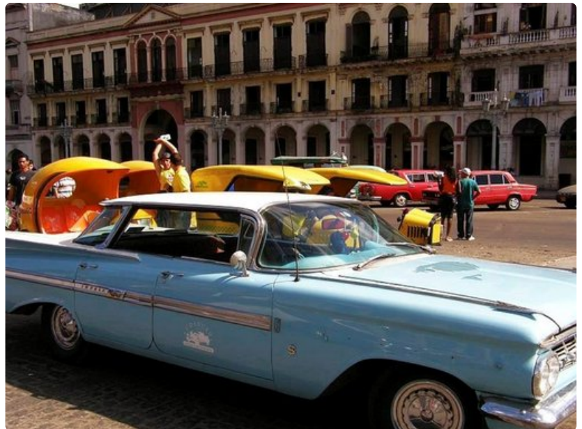
Ladat, mopotaksit ja yli 50 vuotta vanhat jenkkiraudat odottavat kyyditettäviä Havannassa.