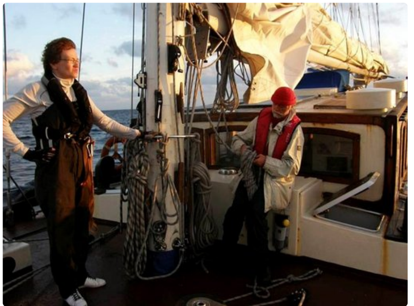
Aamu sarastaa saapuessamme Meksikon rannikolle.