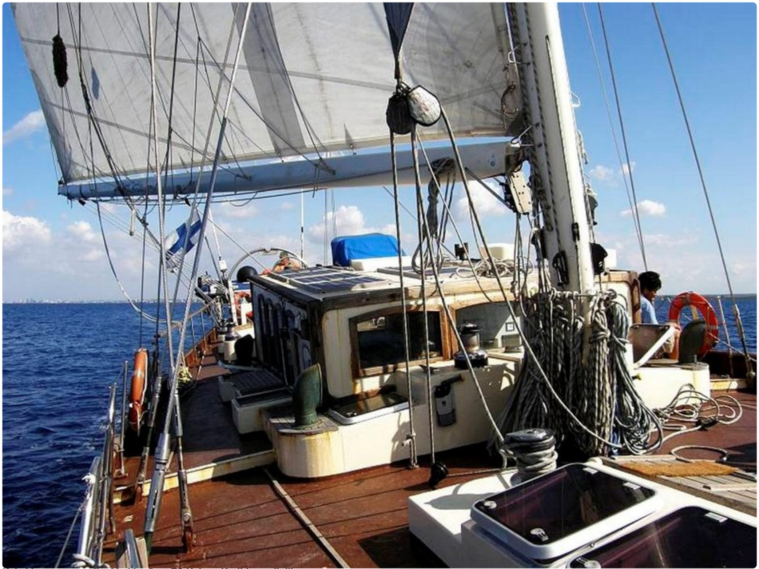
Kaksi kertaa maapallonkin kiertänyt TS Helena Karibian alloilla.