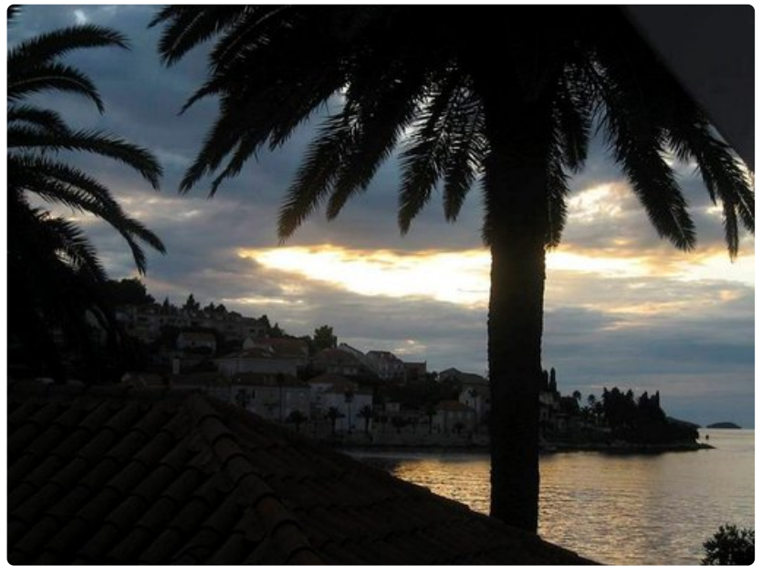
Marko Polon saari, jossa isoäidit pitävät yllä järjestystä.

Oluen hinta baarin tai ravintolan mukaan, alkaen n. 2 euroa/lasi. Talon viini keskihintaisessa ravintolassa n. 10 - 15,- euroa / 0,75 l, laatuviini 0,75 pullossa n. 30,-. Laivalla viinipullo maksoi 12 euroa.