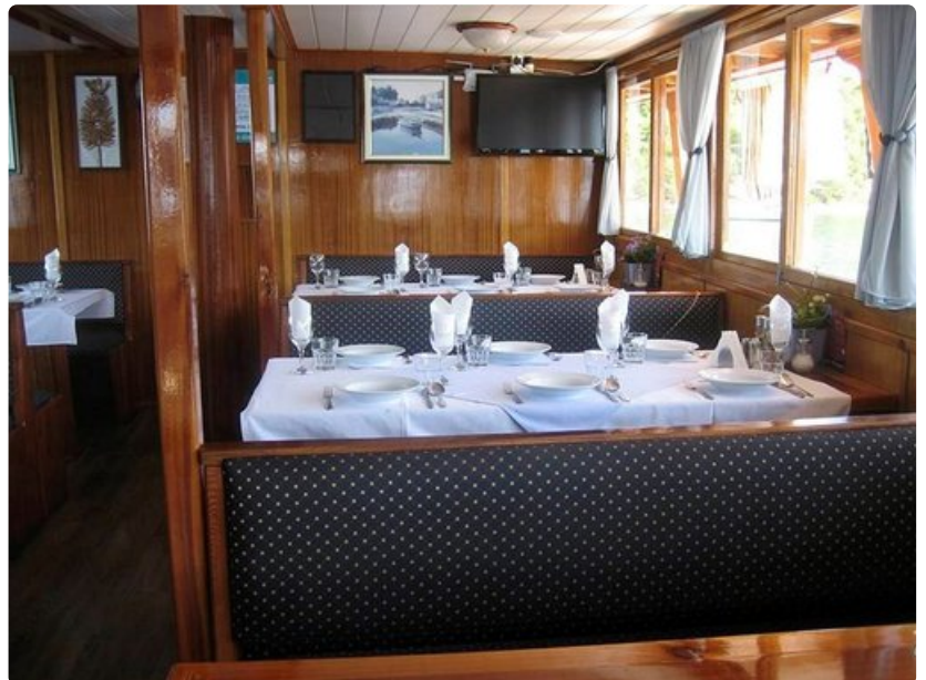
Lounas on katettu salonkiin.