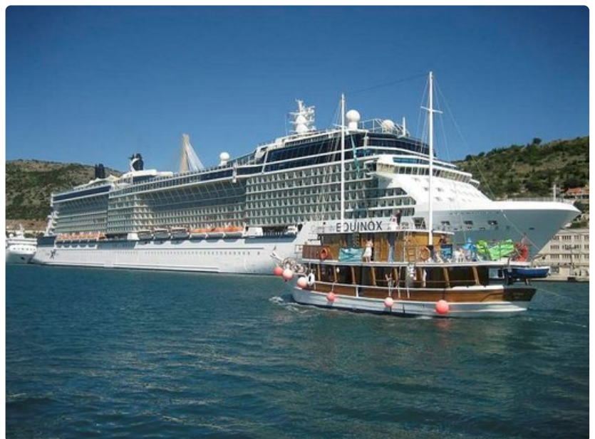
Adrianmerelle on paljon liikennettä.