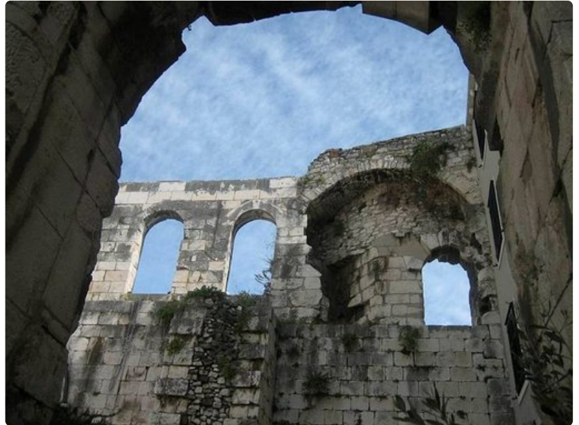
Roomalaisetkin viihtyivät Splitissä.