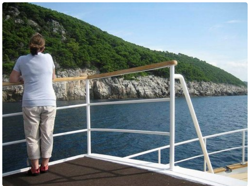
Pienellä aluksella päästään lähelle luontoa.