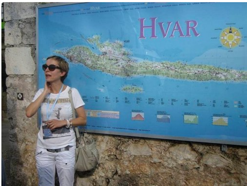
Hvarin saari kartalla.